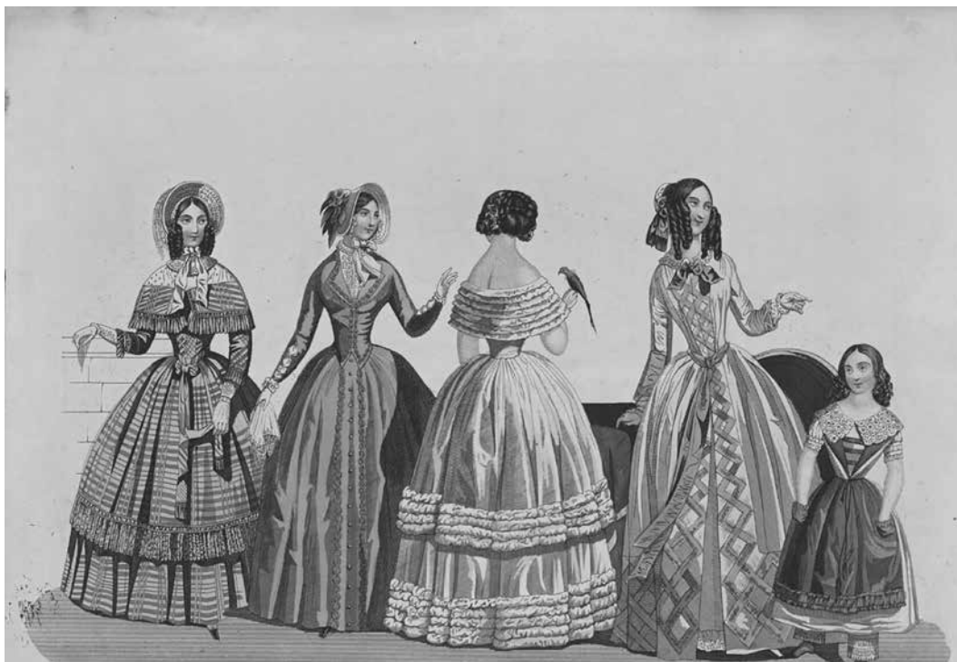
Reformkori női viselet

A mélyen vallásos katolikus keresztény Deák Antal nem ütközött meg az örömlányok tömeges pozsonyi jelenlétén, sőt abban sem talált kivetnivalót, hogy a szóbeszéd szerint maga az esztergomi érsek, hercegprímás, az ekkor egyébként már 65 éves Rudnay Sándor intézkedett azok utánpótlásáról; legalábbis ez derül ki a sógorához 1825 októberében írt leveléből: „Kurva itt annyi volt, hogy keresni se kellett őket, de azt mondják, nagyon fogynak már most, aligha szükségét nem fog városunk szenvedni benne; talán rossz a fuvarjok, elbúsultak szegények s tovább mentek; azt mondják, hogy a prímás tett már rendelt, hogy frissek hozattassanak.” 25 Az sem zárható ki, hogy Deák Antal is fizetett együttlétükért a pozsonyi hölgyeknek, legalábbis erre látszanak utalni a hűgának, Deák Klárának (Oszterhueber József feleségének) vásárolt kalap kapcsán 1825 őszén papírra vetett sorai: „egy kalapnak az ára még nem nagyot rúg az emberen, legfeljebb három jó heverésnek 26 a díja lehet; ha még azok közül is az egyik valamelyik tízszeresen nem költet az emberrel utána”. 27