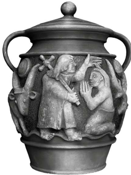
Németh János: Kezdet

A szobor több helyen sérült, a mellkas részéről hiányzik egy darab, a válla többszörösen összetört, felületén kisebb-nagyobb sérülések figyelhetők meg. Mintha magát az emberi lelket ábrázolná, amit az élet sebzett meg. A 2. számú szoborcsoport Ádámot és az almát tartó Évát ábrázolja. Tekintetükben ott a kíváncsiság, ugyanakkor a kételkedés is. A másik két szobor egymásba kapaszkodó apa-fiú párost és egy házaspárt formáz meg. Mind a négy alak tekintete szomorú, ugyanakkor nyugodt is. Az alakokat körülöleli az elmúlás szelleme, amit a kezeletlen felület sérülékenysége még inkább fokoz.