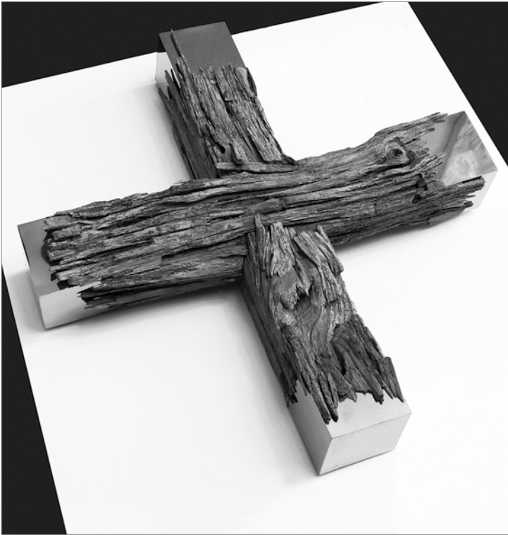
Horváth László: Kereszt