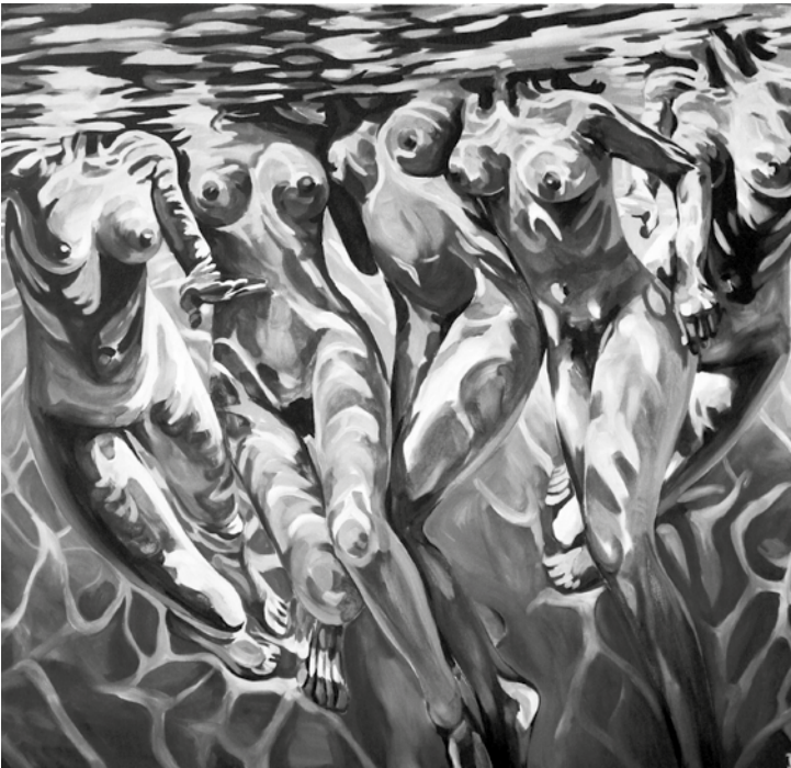
Táncos György: Csúsztatások 5.

más mellett egy boltív alatt, ami a felső sor szélső figuráit eltakarja. A téglalap formájú rubrikákban álló alakok frontális testhelyzetben láthatóak. Fejüket glória koronázza, attribútumaik elmosódnak. A szentek kidolgozása elnagyolt, a kora középkori bizánci freskók sematikusabb figuraábrázolásaira emlékeztet. Ezt az érzetet erősíti Budaházi a felület koptatásával, ami így a lehámló freskó hatását kelti. A kép középső részén a vörös háttérből kiemelkedik a három szent főpap alakja. Nagy Szent Bazil, Aranyszájú Szent János és Teológus Szent Gergely IV. századi püspökök voltak, akiket a görög katolikus liturgia az apostolokkal egyenrangúnak tekint.