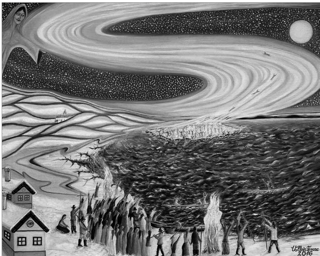
Vollein Ferenc: Vonyarcvashegyi halászok a jégen

esztendőben: Ferenc pápa audienciája, melynek köszönhetően az ifjú festőművész Szent Mártont és édesanyját ábrázoló képe immár a Vatikán egyedülálló gyűjteményét gyarapítja.