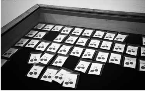
Liz Werbicki: Cherrypopping (videó, performansz, installáció), Best of D'C, Gönczi Galéria, 2016