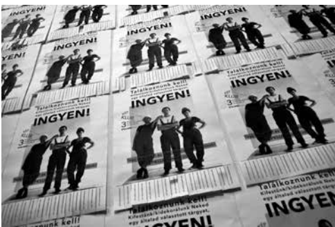
A Kép Klub hirdetőplakátja

És valóban, a Kép Klub híre informálisan terjedt, először fiatalok, párok hívták meg őket... Nem merült fel, hogy ez művészet vagy sem. Maga a közös gyakorlat, a találkozások, a művészek lendületes hozzáállása volt a katalizátor. Hogy lehet szabadabban gondolkodni akár arról is, hogy a művész tulajdonképpen mit is csinál, kicsoda, mi a szerepe? Ez a projekt nekünk is megmutatta, hogy nagyon sok nyitható, aktivizálható ember van.