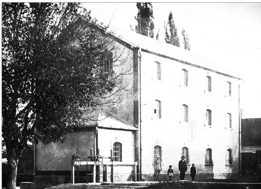
A malom az 1940-es években, északnyugatról

Ma sportcentrum a Vágóhíd utcában. Volt tulajdonosainak leszármazottai az egykori molnárházban élnek 40 .