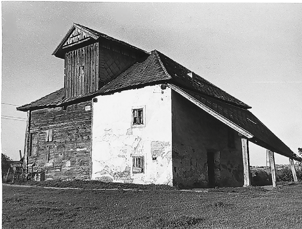
A leállított malom

Az 1949-es kimutatás szerint: Cég: Hencz nővérek. Tulajdonos: Hencz nővérek. Kapacitás: 10 q/24 h. Használhatóság: 10% 8 .