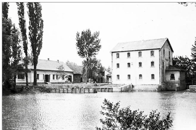
Az új Gömbös-malom