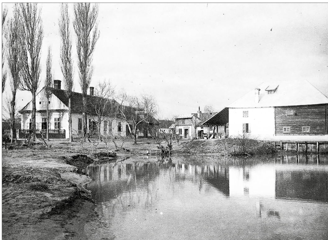
A Gömbös-malom átépítés után