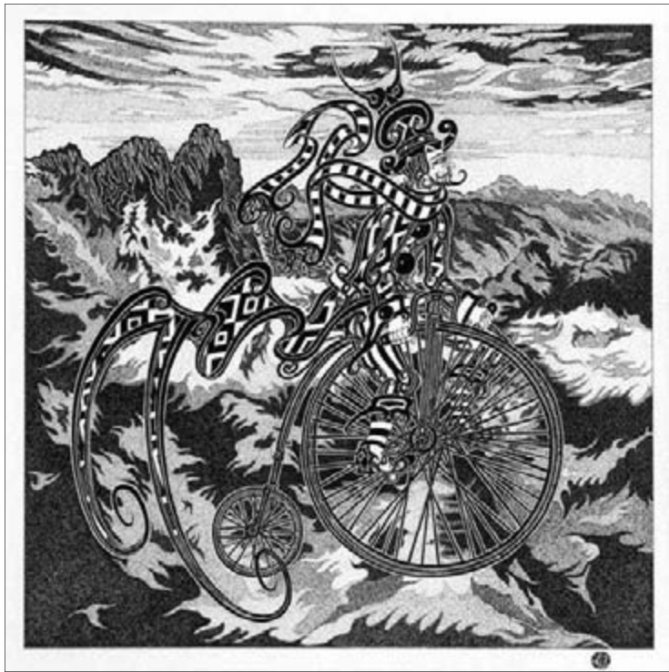
Németh Miklós: Köd előttem, köd utánam (Garabonciás)