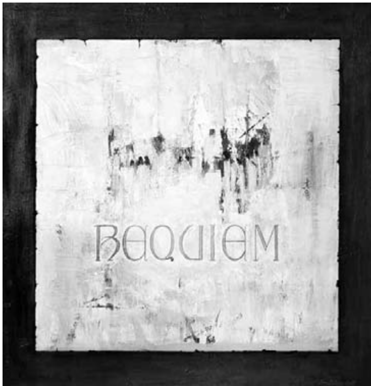
Nagy Kálmán: Requiem