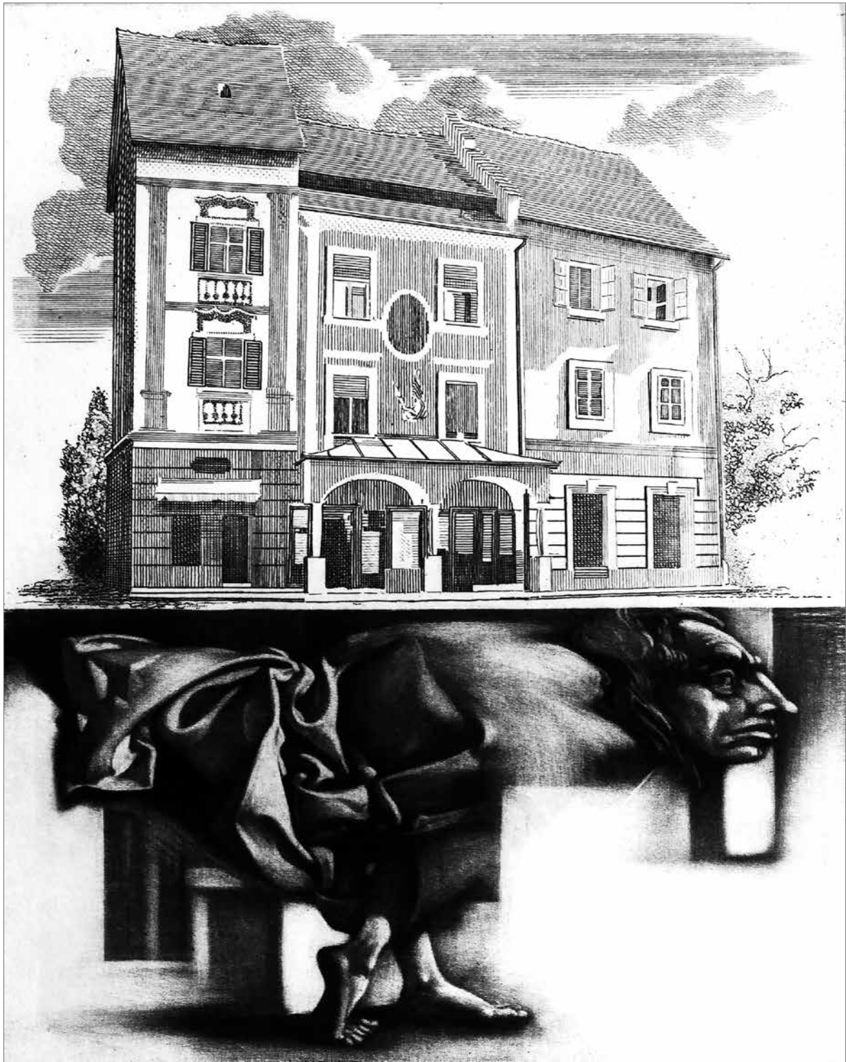
Frimmel Gyula: Madárember – 2010