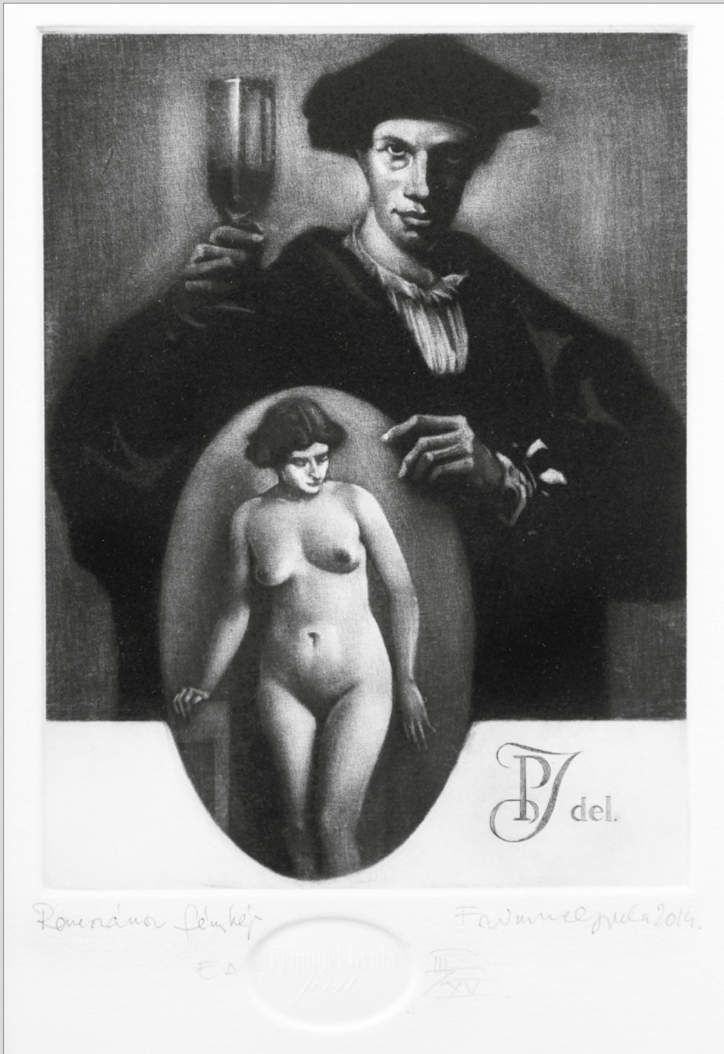
Frimmel Gyula: Reneszánsz fénykép – 2014