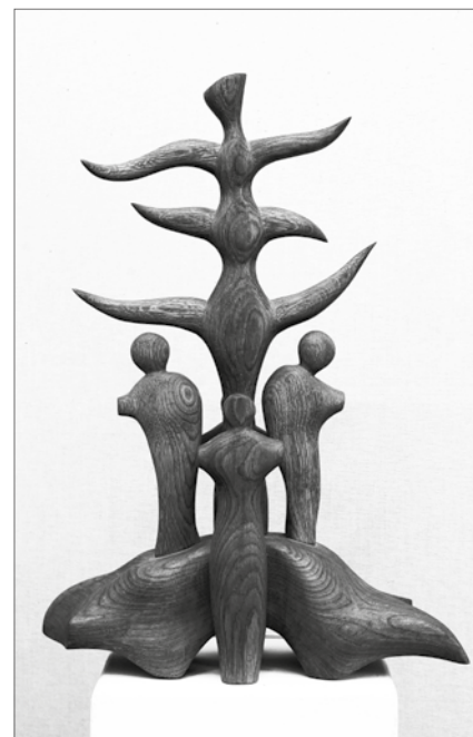
Szatyor Győző: Bálványfa