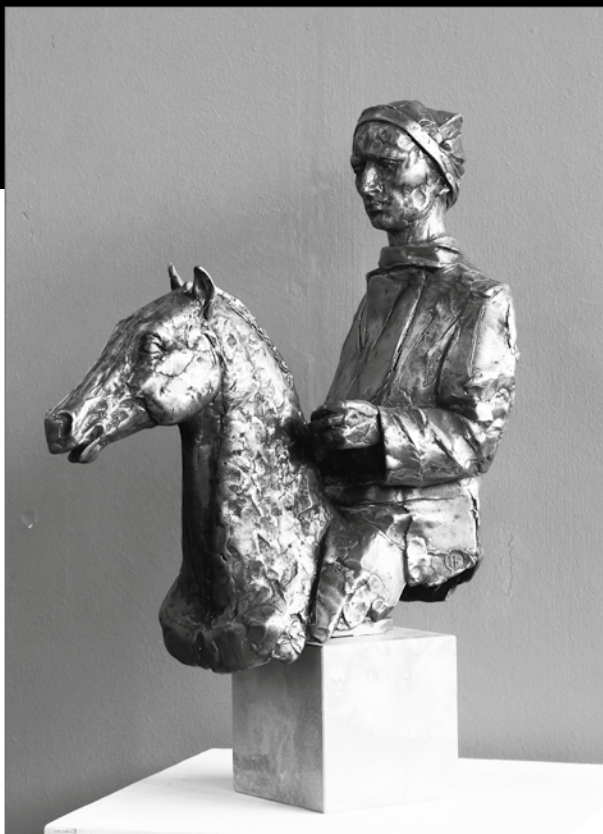
Farkas Ferenc: Lovasszobor - 2014