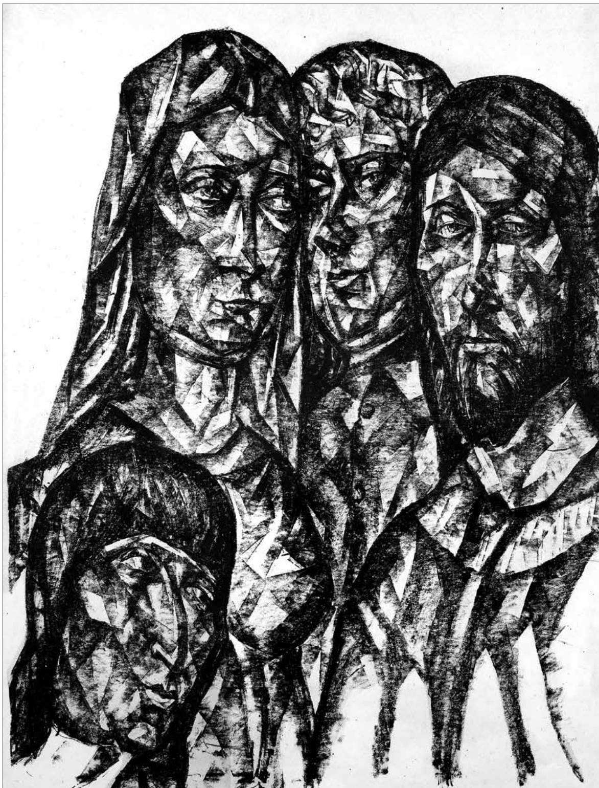
Perlrott Csaba Vilmos: Sirató asszonyok 1922