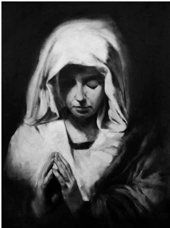
Ardey Edina: Áhitat

ez élete tartozéka, s a fotó így fontos kiindulópontja alkotói felfogásának is. Nem véletlen, hogy később felfedezi azt a grafikai technikát, melynek alapján saját fotóiból, a sötétkamra bűvöletében, végső soron fotógrafikai alkotásokat készített. Ezek kapták a gyémántográfia elnevezést, melyek közül több helyet kapott a zalaegerszegi kiállításon is, jelezve alkotójuk sokirányú technikai érdeklődését. Stílusából később eltűnik a zsúfoltság, s központba kerül a figura, s még itthon tartózkodik, amikor kapcsolatba kerül a Csáji Attila által szervezett szürenon csoportosulással, amely a szürrealizmus eszköztárát, szemléletét (szándékában épp azt is megtagadva) egyesíti nonfiguratív törekvésekkel. Végső soron, akkor (hatvanas évek vége, hetvenes évek eleje!) szürreális telítettségű nonfiguráció keletkezik a fiatal művészek képein, s ez most csak azért is fontos, mert Gyémánt ezt a felfogást is bravúrosan képviselni tudta, noha – a későbbi folyamatok magasából visszatekintve állíthatjuk –, e törekvés nem állt érdeklődése középpontjában, de bizonyos temati-