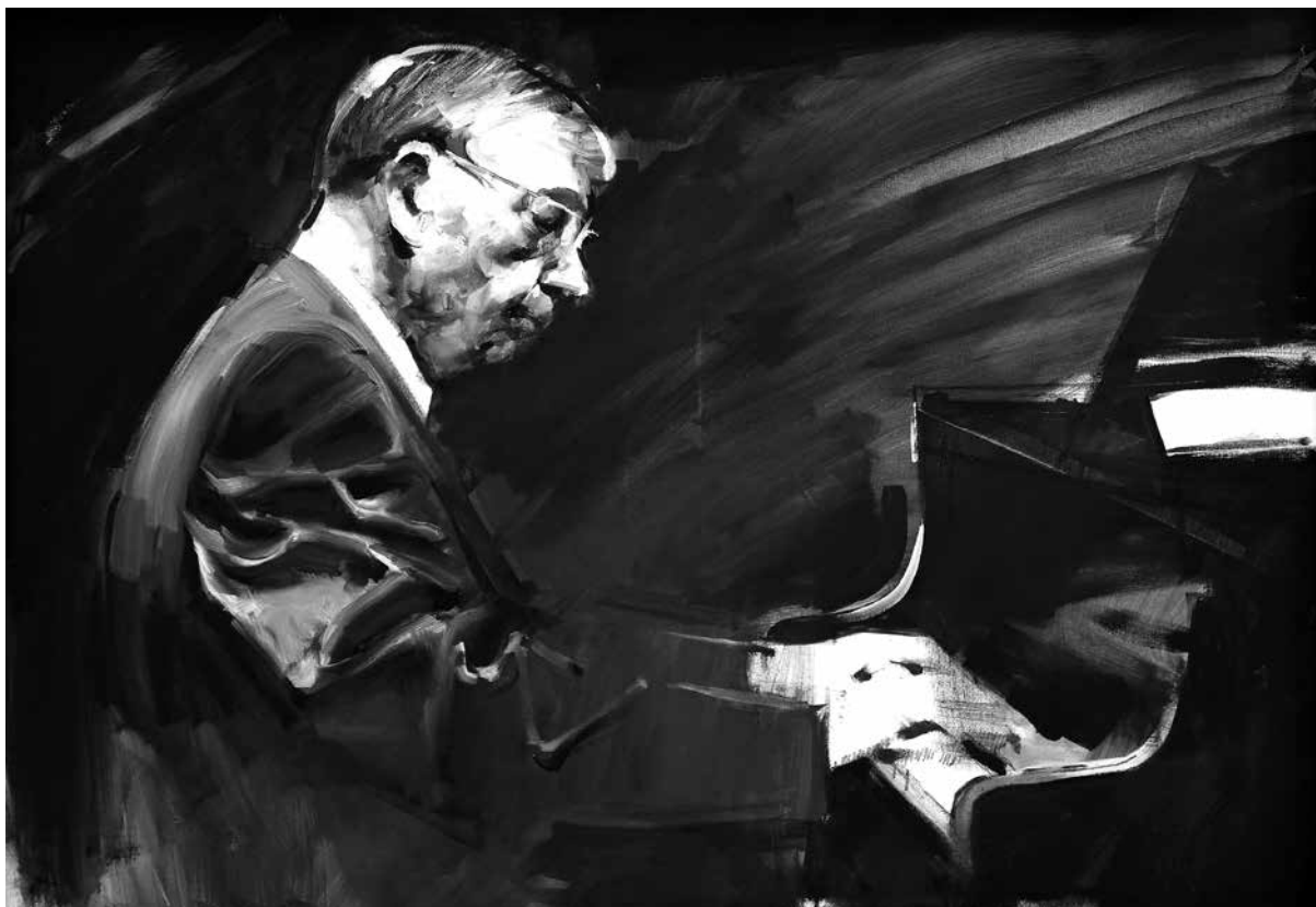
Gyémánt László: Gonda János

költő és felesége kettős portréjával, egyszerűen bravúr. A mára már kissé megtört, testi bajokkal küzdő nagy művész szemei ma is végtelen, világ iránti érdeklődésről tanúskodnak, feleségével való együttese pedig egy harmónia, egy egymásra utaltság érzékeny megfestése. Kiemelkedőek még az Amerigo Totról, vagy szeretett mesteréről, Hincz Gyuláról készített képek is.