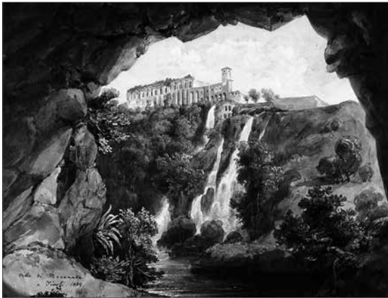
Kozina Sándor: San Giovanni e Paolo, 1830