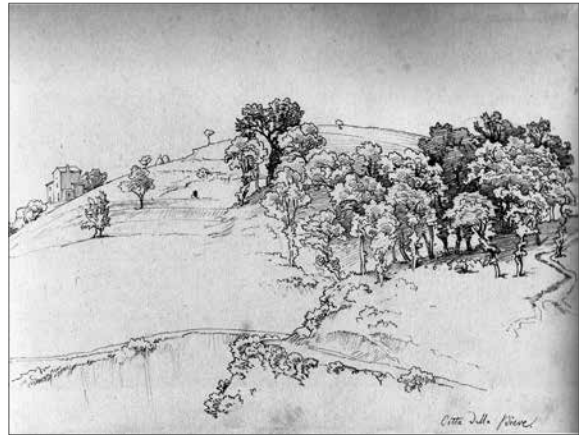
Ligeti Antal: Tájképtanulmány, 1855 körül

része látható. Jó tudni: a Magyar Nemzeti Galéria 1957-től számtalan kiállítást rendezett vidéken és utaztatta a műveket, művészetünket külföld jelentős múzeumaiban ismertté téve. Így például Moszkva, Bécs, Varsó, Párizs, Amerika, Hollandia, Finnország, Németország, Olaszország, Japán művészetkedvelői is láthatták a magyar gyűjtemények remekműveit.