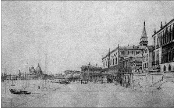
Libay Károly Lajos: Velence a tenger felől, 1850 körül