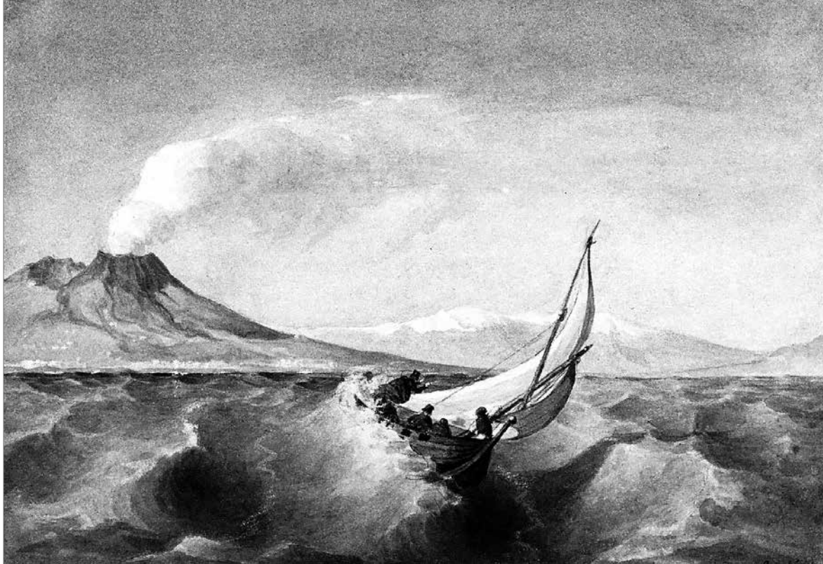
Barabás Miklós: Hullámzó tenger csónakkal, 1830-as évek második fele