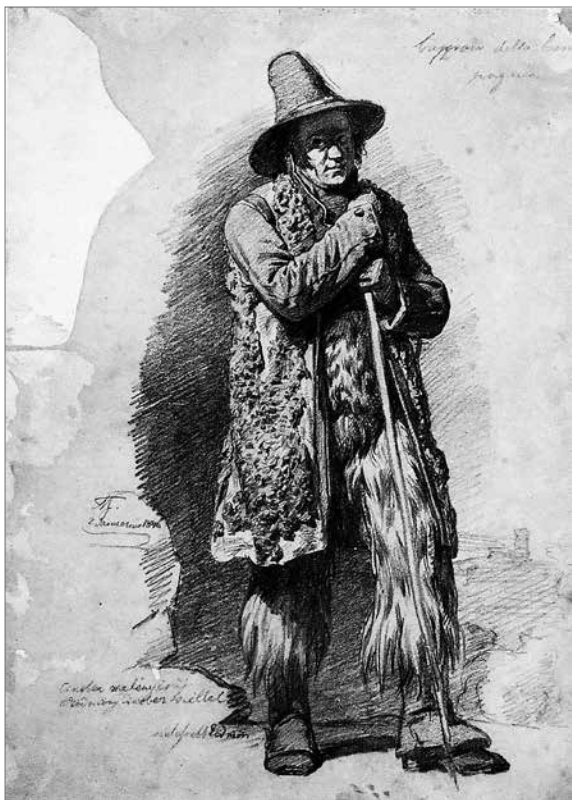
Molnár József: Olasz pásztor, 1840-es évek