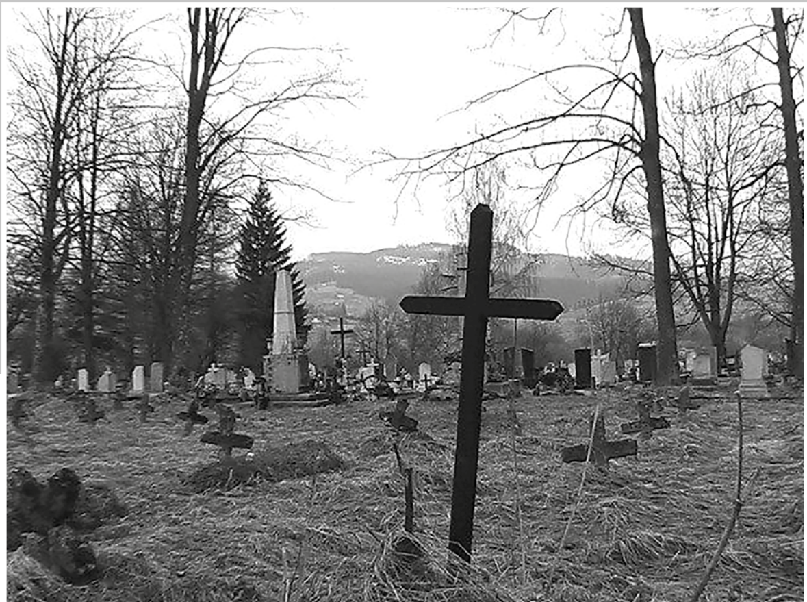
Az I. világháborúban elesett katonák temetője Körösmezőn (Ukrajna: Máramarosi-havasok, Rahó-járás)

„Az ÉLET szép és csodálatos – de megcsúnyítják, elrontják a körülmények, a rossz emberek és főleg a háborúk.”