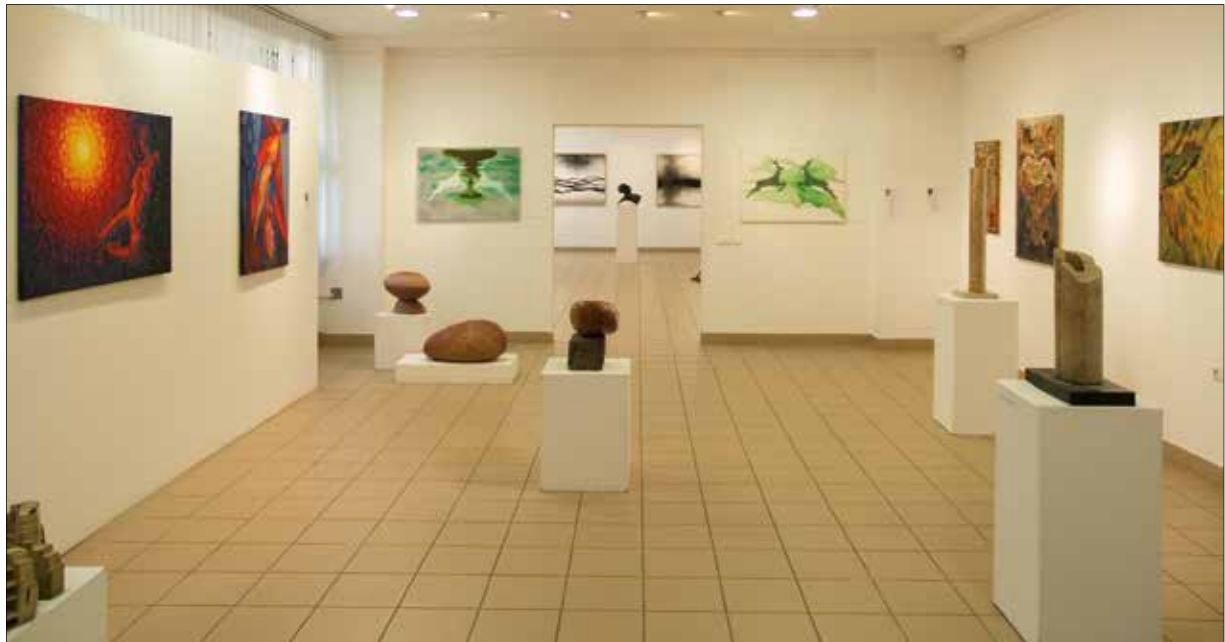
Kiállítási enteriőr a Gönczi Galériában, Zalaegerszegen

drámai feszültsége, azt egyértelműen bizonyítják tusfestményei. A képfelületen nem kalligrafikus tradíció jegyei dominálnak, hanem fekete vonalak, sávok – szinte villámcsapásra emlékeztető – egyéni érzelmi állapotot tükröző impulzusai.