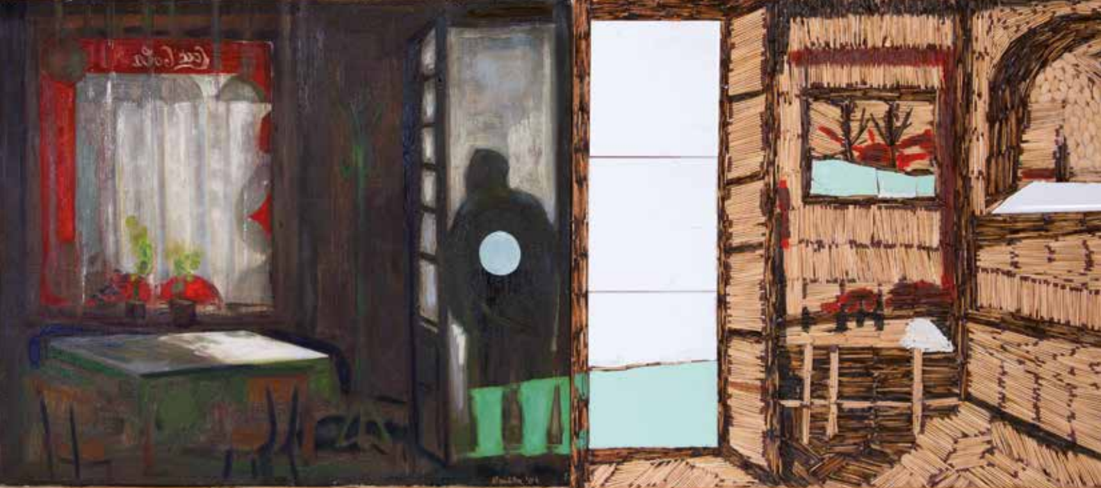
Bukta Imre: Kocsmai képek (Fehér Ökör) - 2004