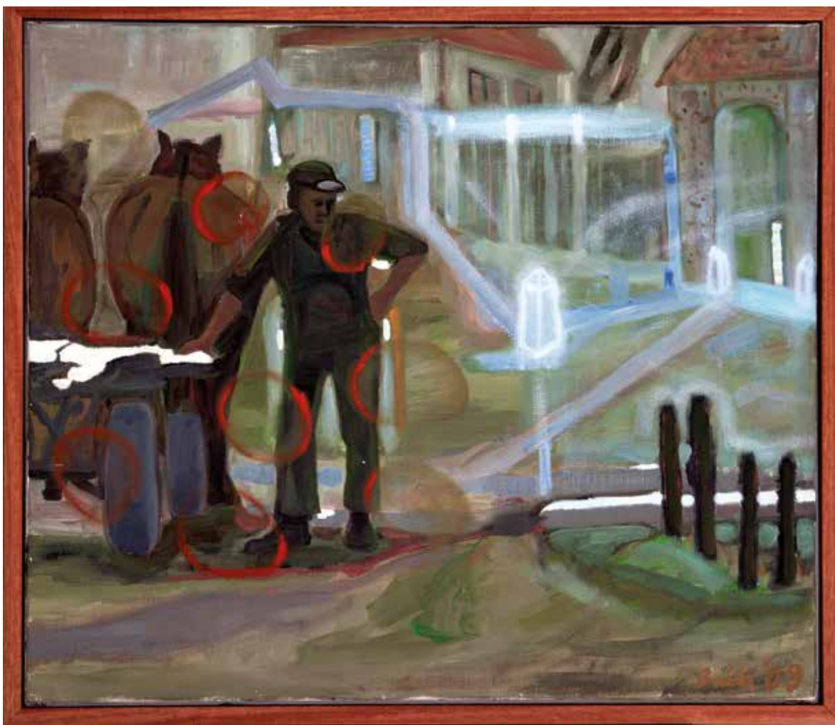
Bukta Imre: Utca Erdélyben - 2009