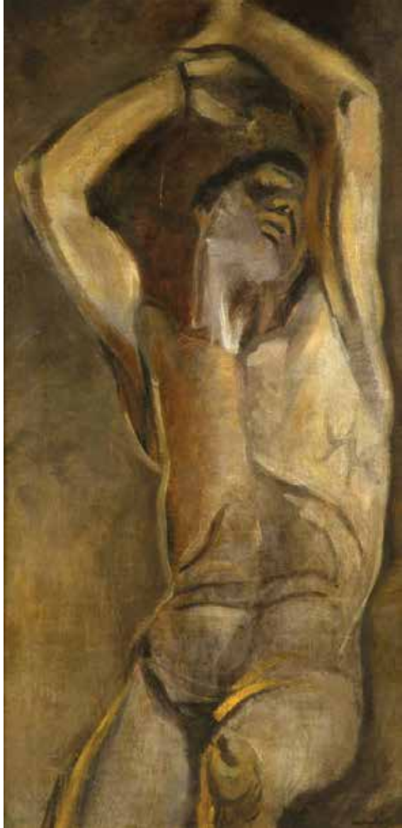
Mednyánszky László: Férfi akttanulmány, 1895

tartó bal kéz eleganciája” mindkét képen magával ragadó. Ha a magyar festők többségét ért korabeli kritikákra és támadásokra gondolunk, nem lett volna meglepő, ha Szinyei Merse egy szabadulni vágyó, lekötött léghajót fest a 19. század végi Magyarországon. Ehelyett azonban megszületett a szabad szárnyalás szimbólumának is beillő Léghajó , mely minden kiállítás üde és vidám színfoltja. A témát valós esemény – Szinyei sógorának léghajós utazása – inspirálta. Mészöly Géza Lido című festménye végre megfelelő kontextusba került! Egy visszafogott felkiáltásból született öröm szállt meg, mikor megláttam a kiállítás első képeit, és az azonnal felismerhető rendezési elvet. Mészöly Lidőjával akkor találkoztam először, mikor Claude Monet és Boudin képei már mélyen beivódtak az érzékeimbe és meghatározták a tizenkilencedik századi francia festészetről alkotott gondolataimat.