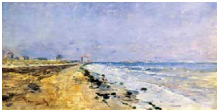
Mészöly Géza: Lido, 1883

jelentenek a külföldön felbukkanó mozgalmak és művésztelepek tevékenységének bemutatásához. A Magyar Nemzeti Galériában látható tárlat segít új kontextusba helyezni a 19. századi magyar festészetet, oly módon helyezi el a magyar művésztelepek alkotóinak életművét, hogy az itt és ott hagyományos rendezési elvet felváltva, az akkor válik meghatározóvá. A szolnoki és nagybányai művésztelepeken folyó kísérletek párhuzamba kerültek a franciaországi eseményekkel. A plein-air festészet nem varázsütésre terjedt el Európában, számos olyan dolog befolyásolta lehetőségeit, melyek távol állnak az esztétikai elméletektől. Nem hagyható figyelmen kívül az újfajta tubusos festékek megjelenése vagy a vasúthálózatok kiépülése, melyek lehetővé tették, hogy a művészek a nagyvárosok szennyezett környezetéből rövid idő alatt az érintetlen természetbe juthassanak.