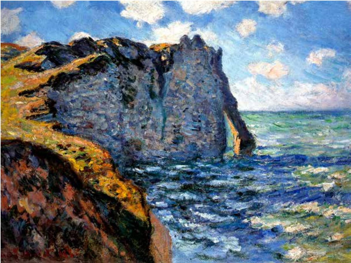
Claude Monet: Az avari sziklaszirt – Étretat, 1882

szolnoki művésztelepen dolgozott, amit nagyon megszeretett. Mednyánszky 1890 és 1892 között tartózkodott másodszer Franciaországban – kisebb-nagyobb megszakításokkal –; a szakirodalom ezt az időszakot nevezi Mednyánszky impresszionista korszakának, mert festményei üdébbek, világosabbak. Kitűnő példája e korszaknak a Tavaszi domboldal című festmény, melynek világos zöldjéből hiányzik mindaz a ború és komorság, mely egyértelműen érezhető az 1893 körüli Dunajeci tájrészleten , és egyre inkább, az édesapja 1895-ben bekövetkezett halálát követő időszakban. Az említett festmény azonban a vörös és a barna színekkel való különleges kísérletként is értékelhető – s így tökéletes ellentéte a tavaszt ünneplő vászonnak –, hisz Mednyánszky, naplójának bevallotta, hogy a vörös sárgás és barnás keverékeit tartja igazán érzékileg izgató hatásúnak. Szerencsésnek mondhatják magukat, akik a Nemzeti Múzeumban látható időszaki kiállításon a júliusi zárásig még elcsípték Mednyánszky azonos témájú festményét, mely magántulajdonban van.