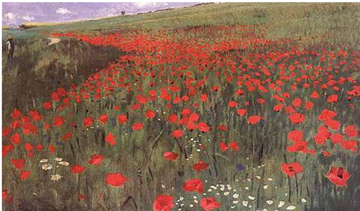
Szinyei Merse Pál: Pipacsos mező, 1896

azonban meglehetősen bonyolult. A francia „próféták” közül Pierre Bonnard, Maurice Denis, Vuillard és Serusier a legismertebbek, de tudunk kell, hogy Rippl-Rónait a Nabis festőcsoport tagjai hívták magukhoz. Előzményként, a festő 1894-ben