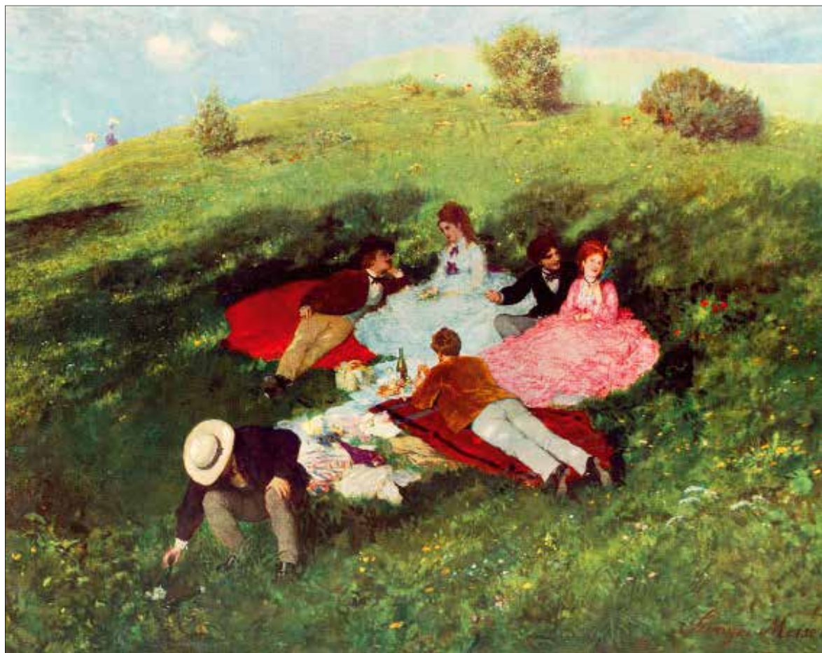
Szinyei Merse Pál: Majális, 1873

(MONET, GAUGUIN, SZINYEI MERSE, RIPPL-RÓNAI Impresszionista és posztimpresszionista remekművek a jeruzsálemi Izrael Múzeum, a Magyar Nemzeti Galéria és a Szépművészeti Múzeum gyűjteményeiből, Budapest- Magyar Nemzeti Galéria, 2013. június 28.- október 13.)