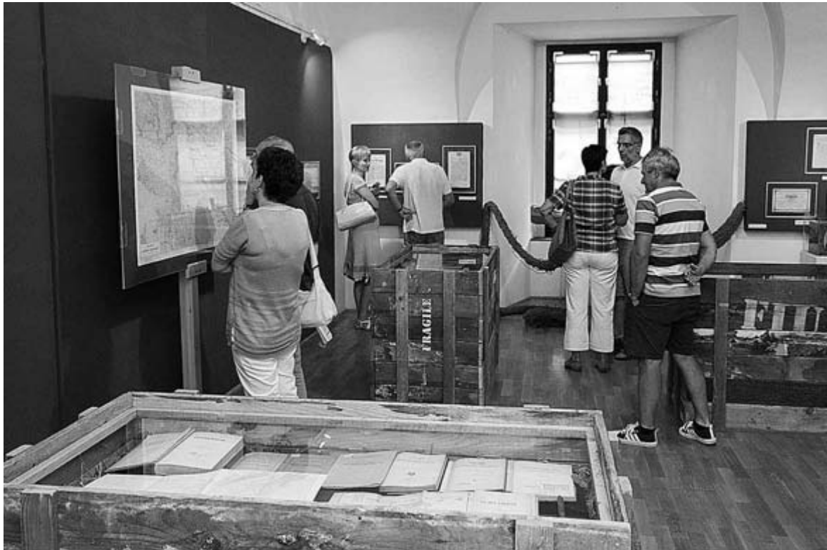
Fotó a megnyitóról...

Az Ung vármegyei Nagykapos mezővároskát, ahol éltek, a két világháború között már három államhatár választotta el a pár évvel azelőtt még ugyanazon országban lévő Fiumétől. Többé nem utaztak oda. A nyugati emigránssá lett Skultéty Csaba csak 1990 után kereshette föl a várost, gyermekkorra képzeletbeli varázslatos színterét. Az évtizedeken át ápolt családi hagyomány és a kései személyes élmény találkozásának hatására született meg elhatározása, Fiume magyar emlékeinek, azok dokumentumainak módszeres föl kutatása, megvásárlása, gyűjtése.