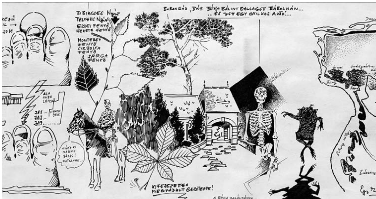
Miklosovits László: Bábolnai napló (részlet) 2011 - papírtekercs, tus - 25x600 cm

Akik itthon maradtak, azokat jobbra védte a