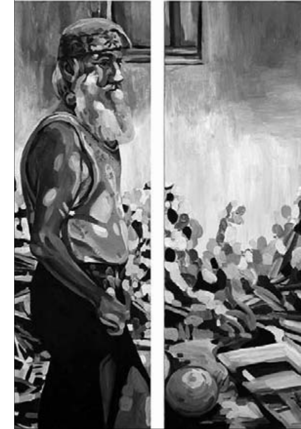
Tanczos György: Sandokán és a labda - 2012 olaj, vászon

Sokféle ez a kiállítás. Ami összefogja a kiállított tárgyakat és alkotóikat, az egy olyan műhely amiben az itt kiállító művésztanárok mellett még sokan vesznek részt a munkában. Hiszen egy ilyen iskola a diákoktól lesz egész, az ő munkájuk és hozzáállásuk az alapköve mindennek. És ha már az oktatásánál tartunk, hadd hivatkozzak egy kedves egyetemi professzorom, Keserü Ilona mondataira: