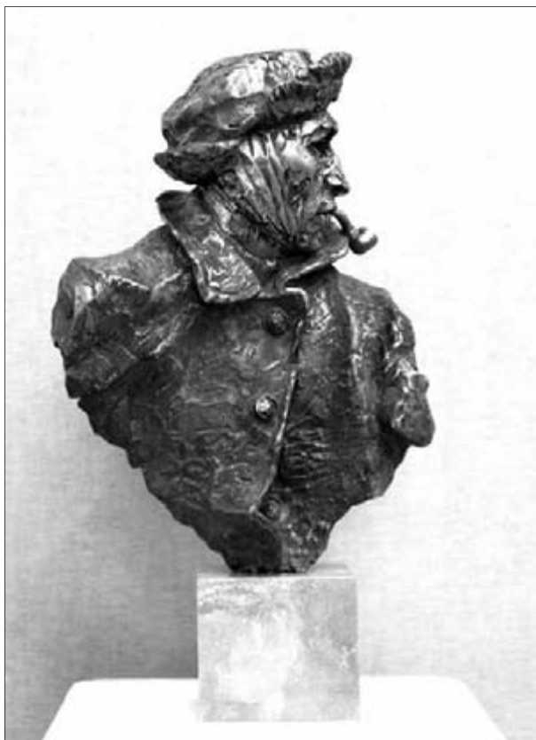
Farkas Ferenc: Vincent Van Gogh - bronz