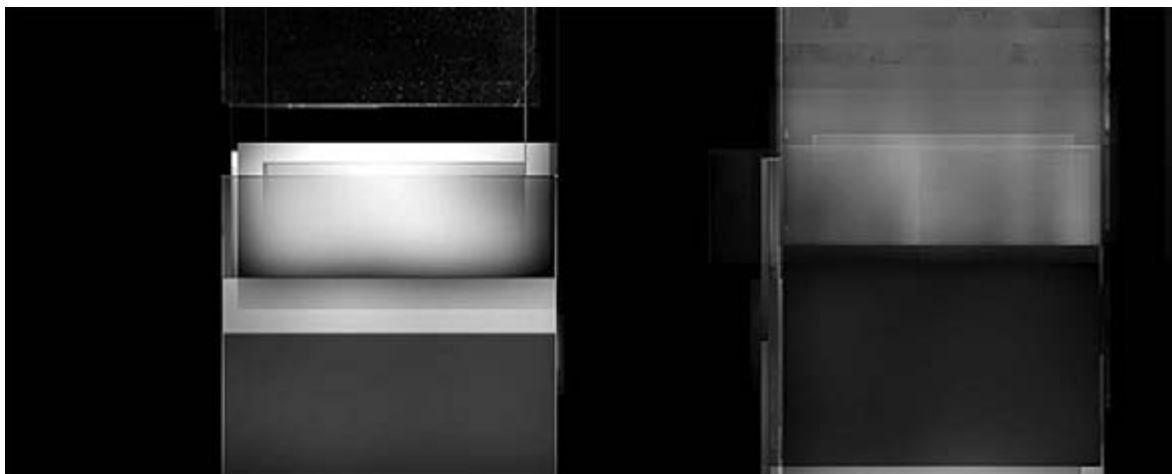
Dziuba: Blue Alternation

Izzó bronzuk csillagképeket ír az égre. Az orgona sípjai requiem-et remegnek, a dallam hallatán életre kelnek a mennyezet freskói. Meszes lábukat nyújtóztatják buzgó angyalok, százezer éve megsárgult énekeskönyveket lapozgatnak a szeráfok. A boltozat, mint hatalmas homorú lencse, összegyűjti a félelmet az állatok szeméből. Gyűjtőpontjában felforrósítja a szorongást, és hamut köhög a gyúlékony levegőbe. (Nagy Gábor György)