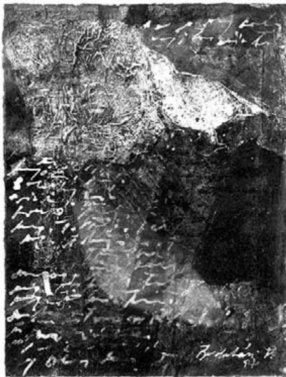
Budaházi Tibor: Madárdal 1997

Annak ellenére, hogy a kereszt, mint legfőbb motívum itt tapasztalt gyakorisága nem lebecsülendő, Budaházi Tibor életművében a figuralitás, akárcsak bújtatott formában is, nem föltétlen önkifejezői módszer. Ám mert a bensőt – az alkotó érzelmvilágát – erősítő művelődéstörténeti adalék a Himnusz költőjétől eredeztethető, a Kölcsey szülőtte földjét jellemző tárgy-együttes, a könyv és a csónak alakú fejfa igencsak megragadta a festőművész képzeletét. Aki egész sorozatot szentelt ebbéli ritmus- és honszeretet-élményének a megvallására. A Szatmárcsekei fejfák (2009) panorámája – a halottakat őriző táj szinte életet adó városként lüktet –, a Szatmárcsekei töredék I. – II. (2008) rajzos katakomba-illúziója, és – nem utolsósorban – a Szatmárcsekei könyvek I. – II. ismert motívumokra épülő, a plasztikus felület hullámzását zenévé változtató, egyszerűségében is impozáns konstrukciója több mint érdekesség: egy dinamikusan fejlődő és gondolatiságában egyre mélyülő művészpálya éke.