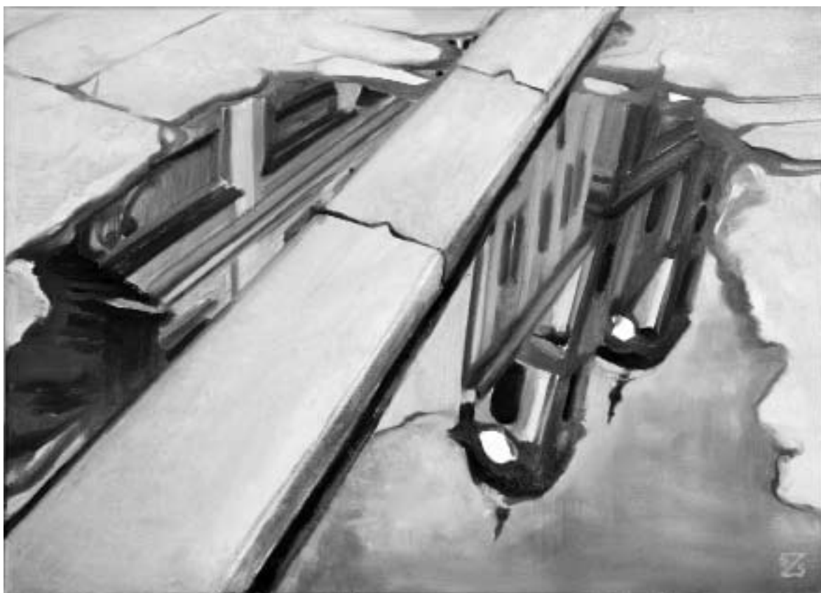
Szablyár Zsuzsanna: Eső Után

A velencei képek egyikén megjelenik az ember is, mint a szűk sikátorban mozgó turistacsoport. Szablyár Zsuzsanna tud jellegzetes, a kép témájához illő alakokat is teremteni.