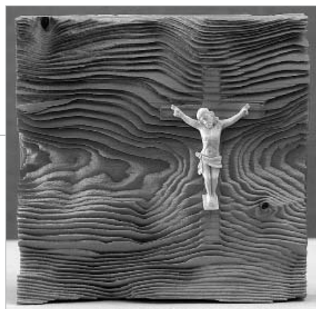
Bohus Áron: "Kezdet és vég"- Ég és föld között

színpadképszerű illusztrációkat készíteni. Műfaji tájékozódása és szakmai felkészültsége az ő esetében is imponáló. Azt mondják: a tehetség és felkészültség karöltve jár. Ez a művészpár esetében több értelemben véve is igaz. Esetük arra is meggyőző példa, hogy a vérbeli profizmus nem akadály, inkább elősegítője a valódi szakmai kibontakozásnak.