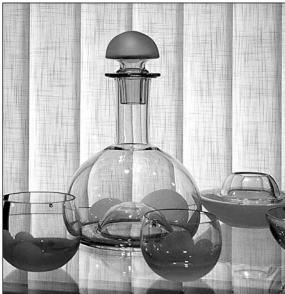
Széplaki Tibor munkája