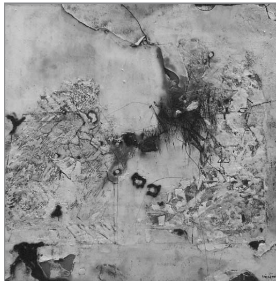
Paizs László munkája

– Először biológus, majd külügyi diplomata – mondván, így külföldre ki tudunk menni –, végül díszlettervező szerettem volna lenni. Kiderült, hogy az Iparművészeti Főiskolán díszlettervező szak nem indul. Felvételizni Budapestre kellett jönni. Akkor jártam először a