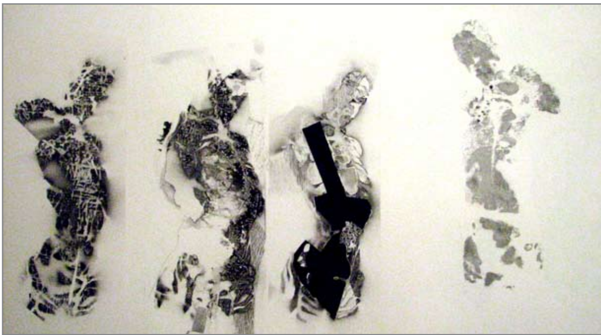
Paizs László munkája

– Jó kérdés. Nem csak a főiskolán, hanem a gimnáziumban is foglalkoztattak különböző anyagok. Láthatod, itt a kiállításon is, hogy nincs olyan anyag,