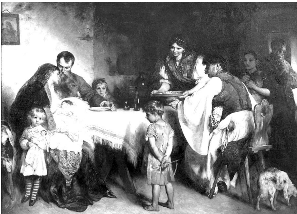
MENEKÜLTEK, 1882, o.v., 93 x 130cm, népi zsánerkép, Magyar Nemzeti Galéria, A Müncheni Akadémia díjnyertes alkotása a Jár a baba c. képpel együtt

A képet később a Ludovika Akadémián helyezték el, onnan deponálták 1945 után, végül így került restaurálva – sok évtizednyi késéssel – a Hadtörténeli Múzeumba. Lengyelországban, a lwów-i Rondellában Jan Stykával együtt részt vett az úgynevezett Erdélyi panoráma , más néven Bem-Petőfi körkép létrehozásában. Ezt Jan Styka később sajnos szétszabdalta kisebb darabokra és különálló festményekként értékesítette.