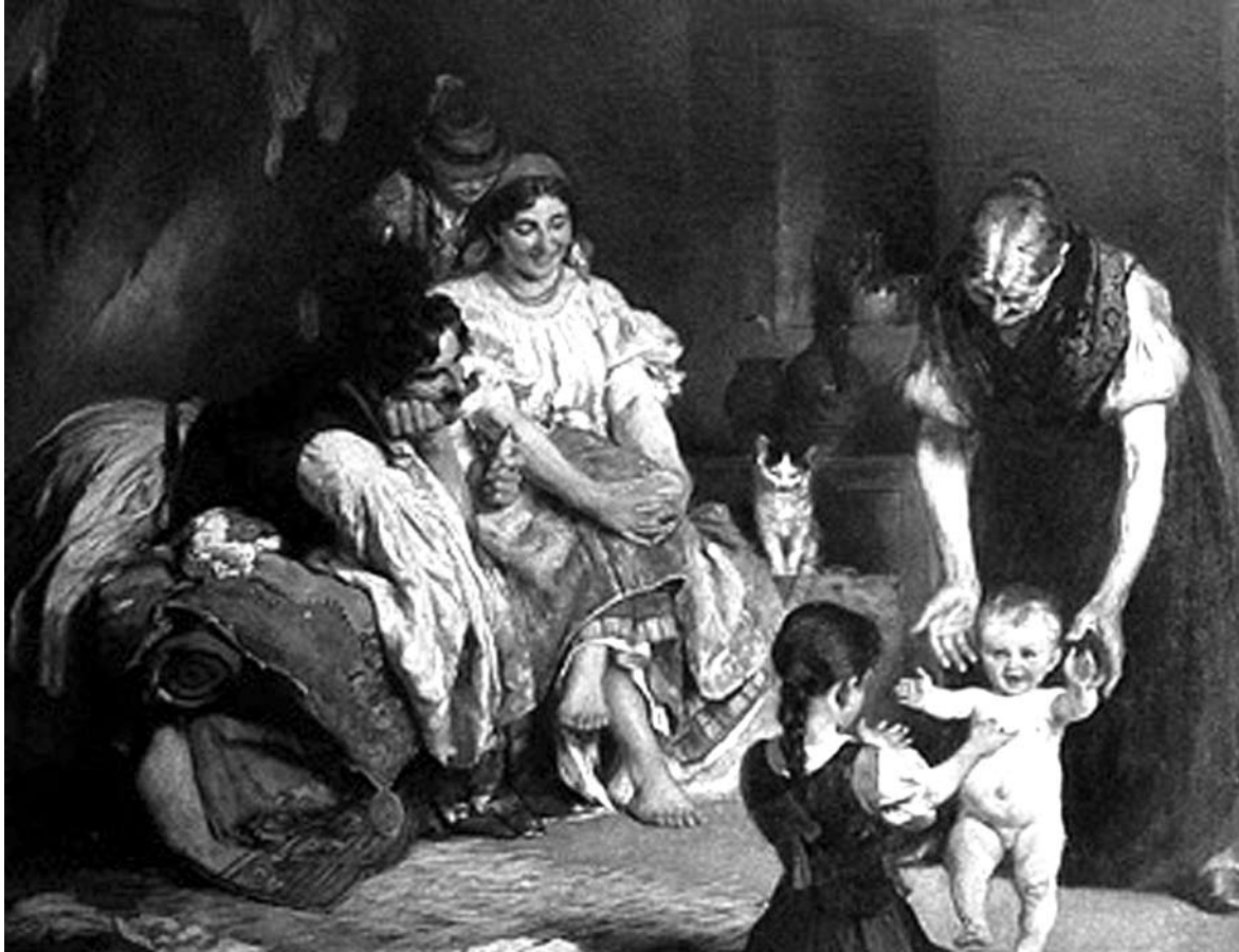
JÁR A BABA, 1881, o.v., 150 x 110cm, népi zsánerkép, magántulajdon

Egy pillanatra térjünk vissza ahhoz, hogy miféle kapcsolat állt fent Zala György és Vágó Pál között: Vágó a millenniumi esztendőben történelmi díszfelvonulást tervezett, ez ugyanakkor történt, amikor Zala György bemutatta a Millenniumi emlékmű tervét. Vágót az izgatta, hogyan lehet eleven mozgás a festett mozgásból. Mecénás – ma úgy mondanánk: szponzor – hiányában azonban mindez csak terv, álom maradt. Elkészített egy 60 méteres vázlatot pannón, ám a sok rajz mind papíron él.