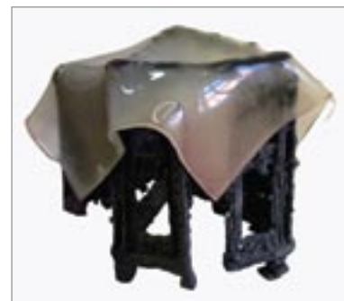
Sörös Rita: Kint és bent