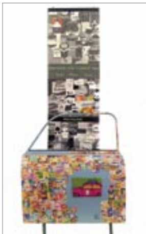
Ruczek Zsófi: Kivetítés