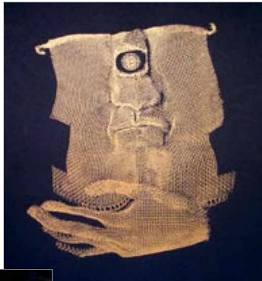
Lendvai Péter: Kyklopsz I.