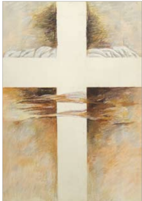
A forradalom előérzete (1985)