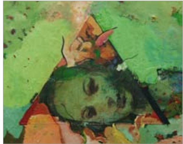
A hit című sorozatból