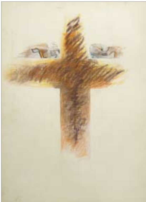
A forradalom előérzete (1985)