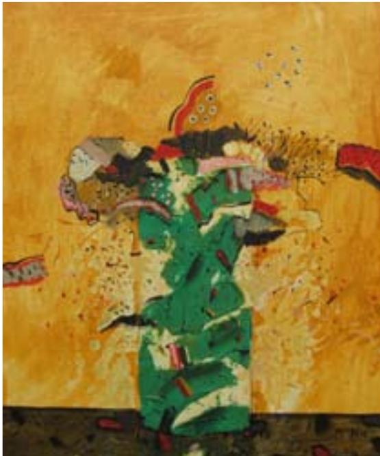
Az ezredforduló virágai (2008)