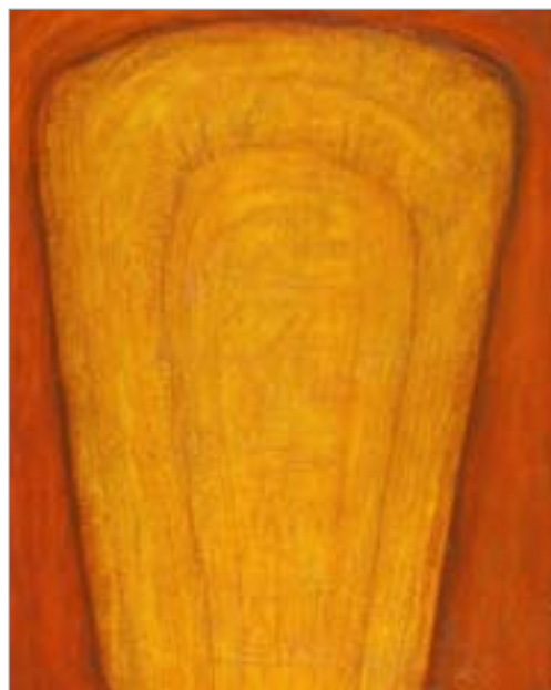
Karner László: Jelek