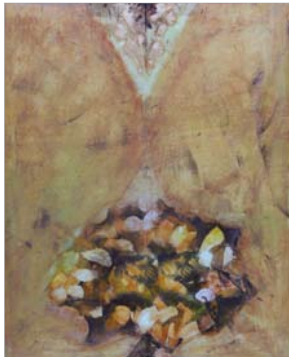
Pannon Madonna (2008)