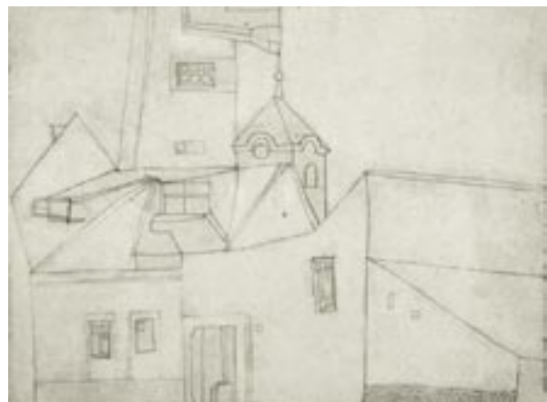
Vajda Lajos: Háztetők toronnyal 1936