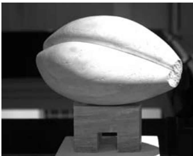
Ágoston Zoltán: A lassulás esztétikája