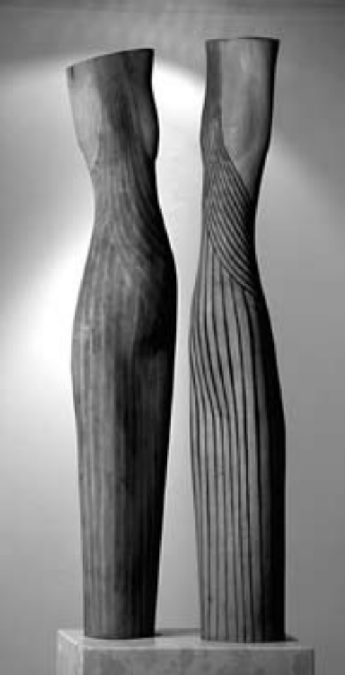
Kuti László: Vizitáció 2007