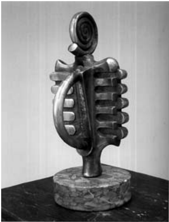
Hunyadi László: Pentaton (bronz)

Egy másik csoportosulás 2002-től lepi meg szokatlan kínálatával a közönséget. A Totem nevet viselő kiállítás ősi és jelenkori jelképeket szervesen egybekapcsolva vonultat