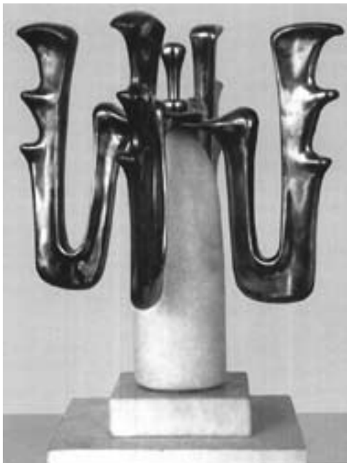
Kiss Levente: Matolla (bronz, márvány)