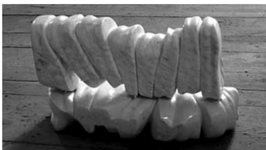
Pokony Attila: Gyűrődés (márvány)