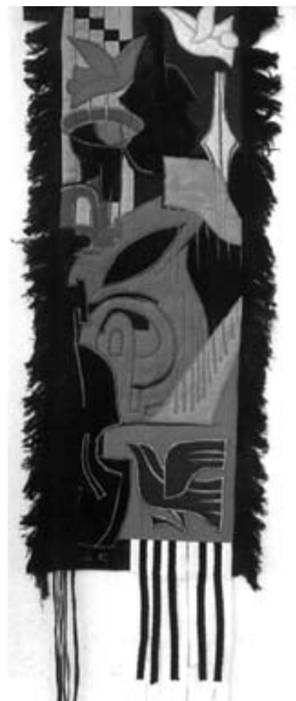
Bandi Kati: Zene (faliszőnyeg)