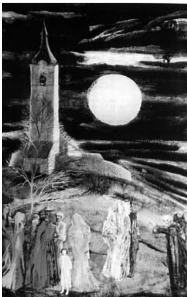
Barabás Éva: Titokzatos krónika (olaj)