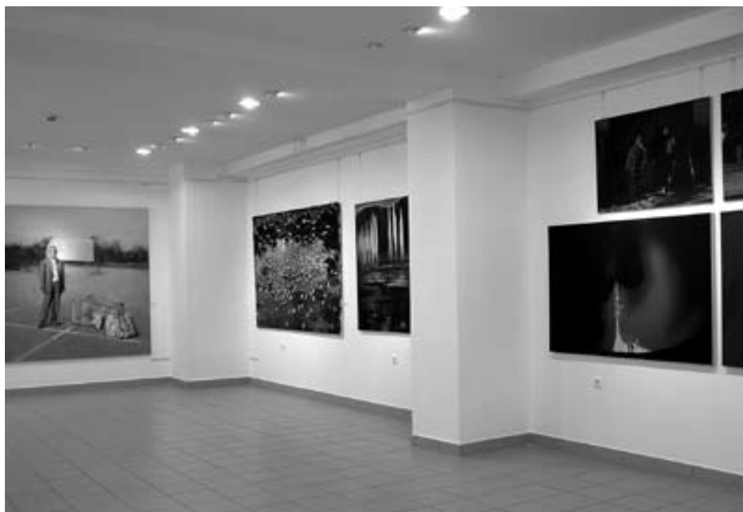
Enteriőr a kiállításról