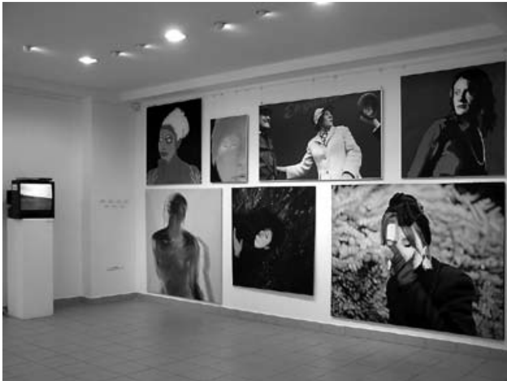
Enteriőr a kiállításról

(Szövegünk a 2007. január 19-i megnyitón elhangzott gondolatok írott változata.)