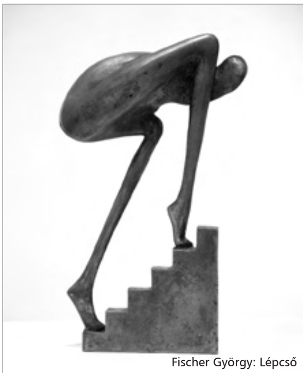
Fischer György: Lépcső

Fischer György szobrászművész világának középpontjában az ember áll. Az emberi figura a klasszikus görög szobrászat óta az európai szobrászat egyik legnagyobb tradícióval rendelkező motívuma. Fischer György e klasszikus formavilágot azonban egyéni módon, a XX. századi ember képére alakította át. Alakjai súlyosan deformáltak: tömbbe foglalt testükhöz nyúlványszerűen kapcsolódó, csenevész végtagok társulnak. Nem csupán testarányuk, hanem maga a tartásuk is groteszk. E figurák soha nem egy bizonyos cselekvéssel vannak elfoglalva, nem is konk-