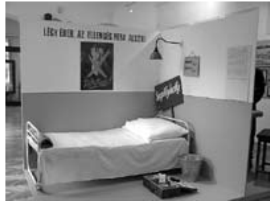
"Mindenki szem a láncban" Így éltünk az ötvenes években