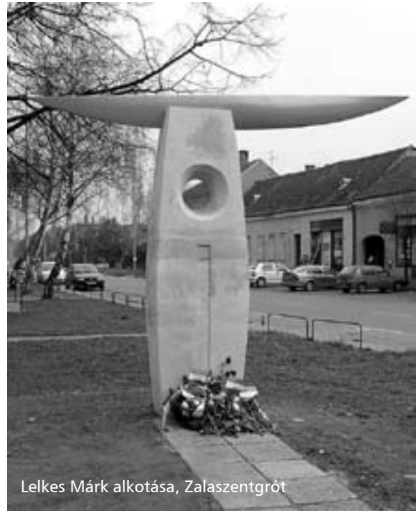
Lelkes Márk alkotása, Zalazentgrót

illető neve „szégyentáblára” került. Netán az egyen néprádió harsogta világgá a szégyenteljes nevet, megfelelő kommentár kíséretében. Az indulókat és egyéb szocialista műdal-szerzeményeket füzetekben lehetett ingyen kapni, s az egyik film címe is azt sugallta: „Dalolva szép az élet”.