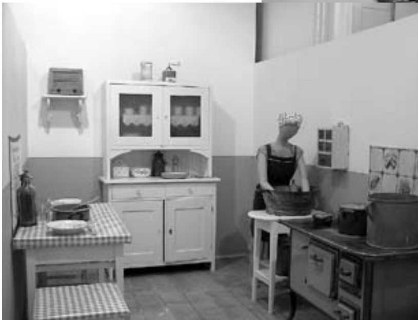
Enteriőrök a Göcseji Múzeum kiállításából