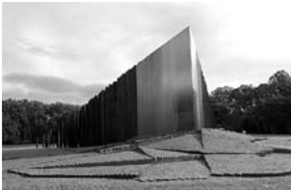
'56-os központi emlékmű, i-ypszilon csoport

A forradalom 50. évfordulója felé közeledve, némileg Tamási Áron 56-os Írószövetségi felhívásának, a Gond és hitvallásnak címét variálva, Gond és felelősség – ez jutott eszembe. Hiszen sokak készültek az ünneplésre – a méltó ünneplésre – s nem a legkedvezőbb társadalmi légkörben. A politikai megosztottság ide is „begyűrűzött”, aminek jeleit már-már unalmas volna felsorolni. Természetesen ízlésbeli, gondolkodásbeli különbségek is „színezték” az álláspontokat, főként az emlékmű-állításokkal kapcsolat-