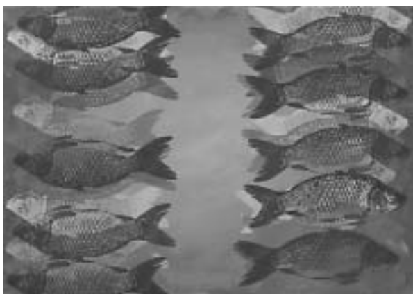
Pinczehelyi Sándor: Megfordítható kép - akryl, szita, vászon