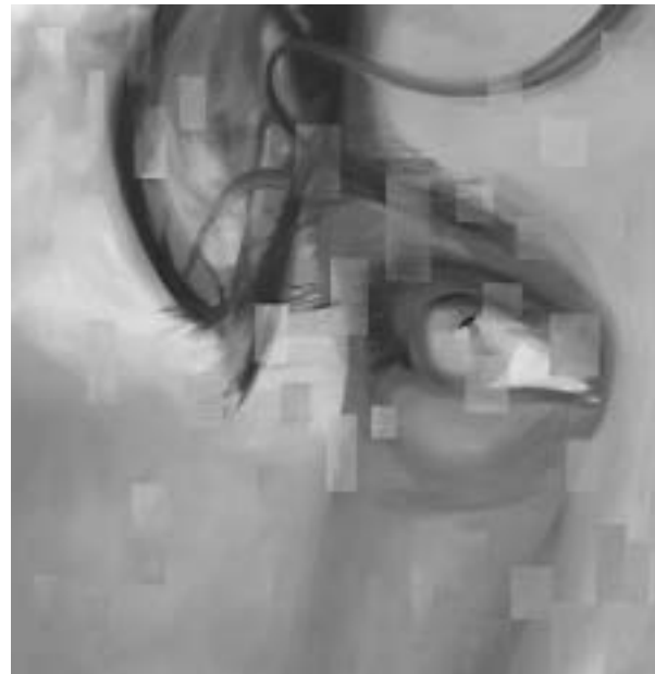
Knyihár Amarilla: Zsolt szeme - olaj, vászon

Knyihár Amarilla ugyancsak nem elégszik meg a „puszta”