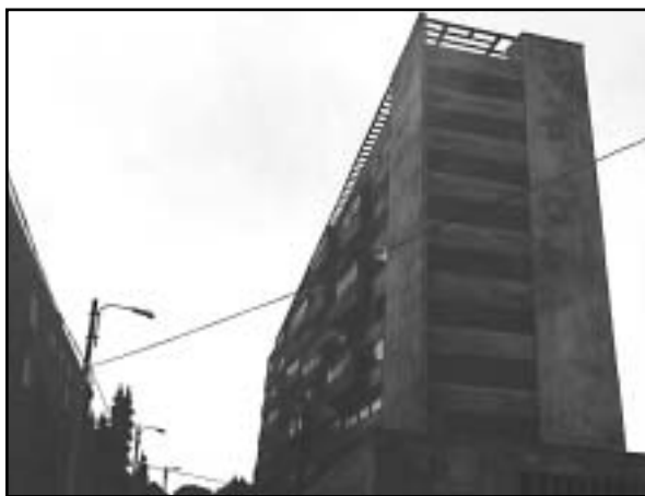
Sorin Sorasan: Urbánus tájkép I. - akryl, vászon