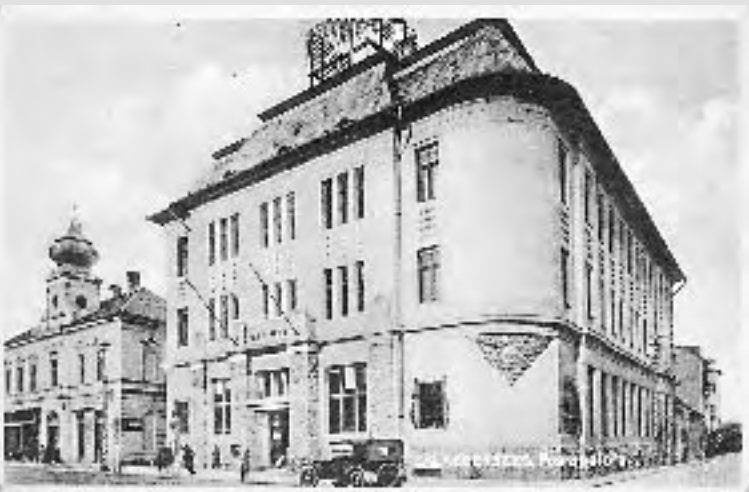
Nemes Gábor „Petőfi” könyvkereskedése kiadása 1930