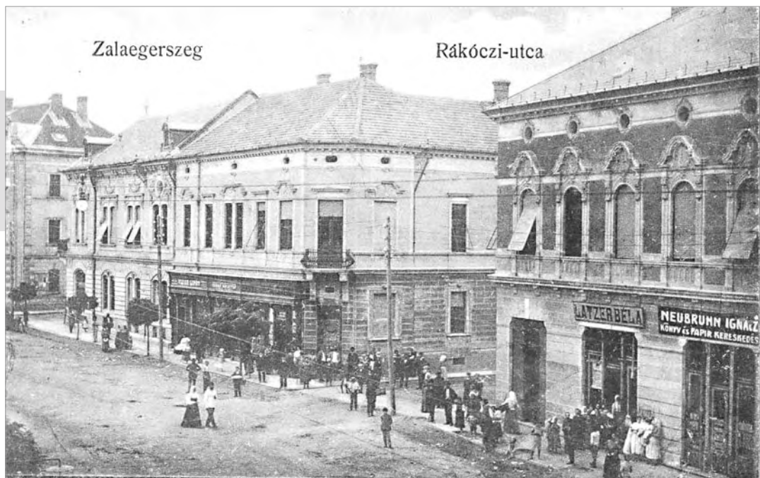
Hangya fogyasztási és értékesítő szövetkezet kiadása 1910 körül