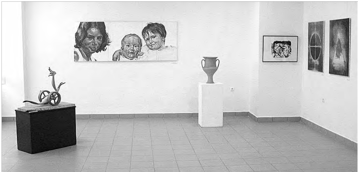
Részlet a kiállításról

Ha végig tekintünk e kiállítás képein, akkor saját arcunk, a mások arcai világlanak fel. Kiváló műalkotások és művészek, akik fontosnak tartották, hogy közösen egymás mellett szerepeljenek, és nyitottságukkal bevonják a közönséget is e játéktérbe: az értelmezés soha sem lezárt, állandó megújulásra kész, így generációk folyamatosságát tudja szakadékokat és töréseket áthidalva újragenerálni. Üresség és üresedés nélkül.