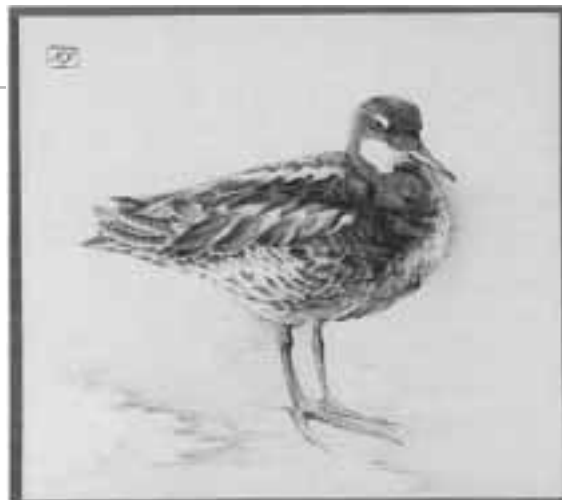
Víztaposó, 1998 papír, színes ceruza

megnyilvánulása. A kompozíció arany pipacsokból áll és öt további motívumból. Az arany pipacs – azon kívül, hogy legfőképpen magyar motívum – elsősorban a növekedés, a szépség, a szerelem és a múlandóság jelképe. Az arany színű pipacsok diagonális elrendezésűek. Közöttük helyezkedik el a többi motívum. Így a szőlőfürt, mely a béke, a jólét, az ősz és a termékenység jelképe. A második sorban egy galoppozó ló jelenik meg, mely a kitartást, a sebességet, a szerencsét szimbolizálja. Isteni hírvivő, a termékenyítő erő jelképe. A Nap és a győzelem perszonifikációja. A középső és egyben a harmadik sorban egy búzakarász látható, mely az élet és halál egybefonódását, a meghaló-feltámadó vegetációt jelképezi: „Ha a búzaszem nem hull a földre és nem hal meg, egymaga marad, de ha elhal, sok társat hoz”. A negyedik sorban madarak reppennek fel, ezek az égbe emelkedést, a lelket és a szellemet szimbolizálják, valamint a szabadságot és az intelligenciát. És végezetül a kompozíciót alul pegazusok zárják, melyek az ihlet, a költészet, a magasba törő, halhatatlan lélek megtestesítői.