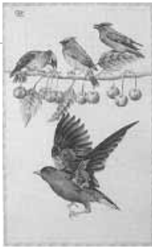
Cserezhnyés-madaras, 1998 papír, színes ceruza