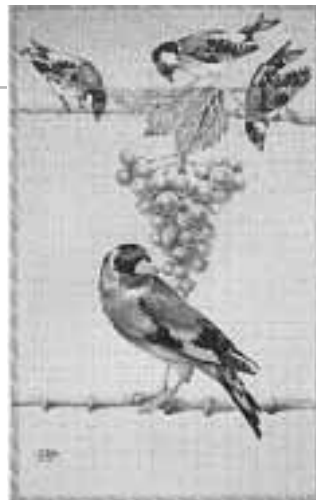
Szőlőfürt madárral, 1998 papír, színes ceruza