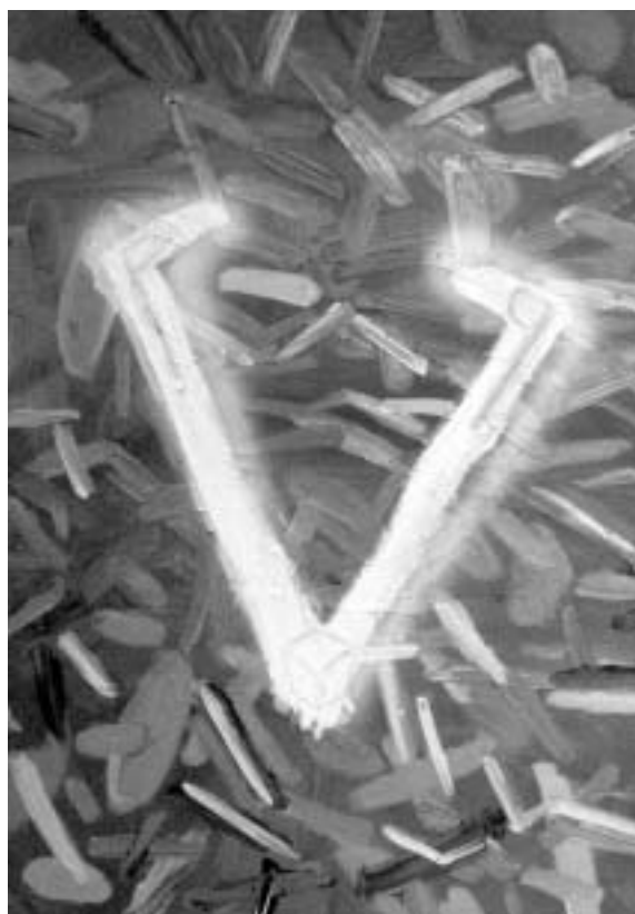
Szentgróti Dávid munkája - Magyarország