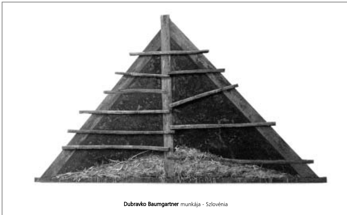
Dubravko Baumgartner munkája - Szlovénia