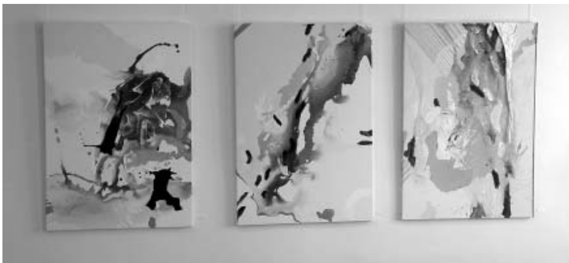
Kiállításrészlet a Lind-Art tárlatáról