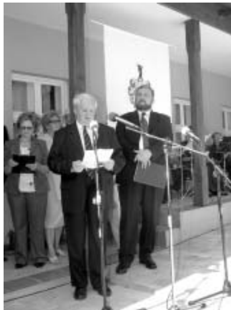
Pomogáts Béla a Bánffy Központ avatásán

Minden kulturális központnak és otthonnak, minden Magyar Háznak és persze minden magyar iskolának, egyesületnek, önkormányzatnak és egyházközségnek ilyen idegdúccá kellene válnia. Ezért kell kijelentem – értelmezhetik ezt Önök az Illyés Gyula Közalapítvány elnökeként tett kijelentésemnek is