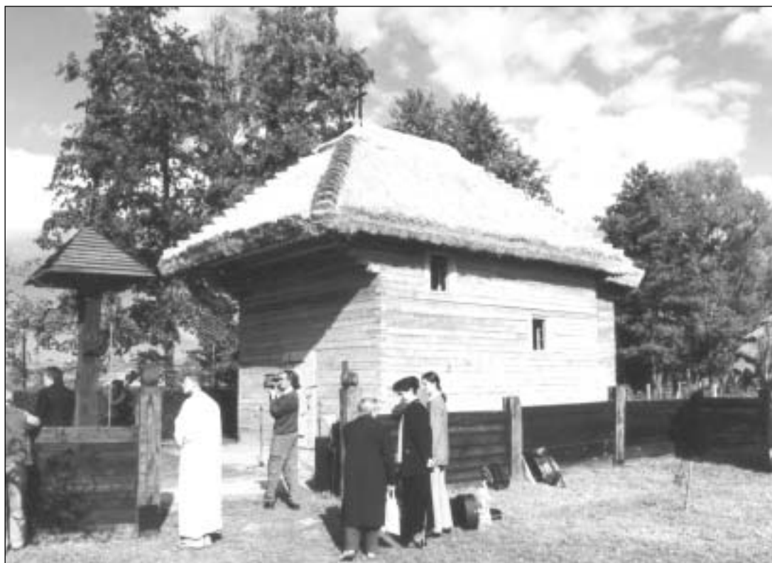
Avatás előtti pillanatok

2002 őszére elkészült a templom és azóta a nagyközönség rendelkezésére áll. Talán hamarosan rendeznek benne esküvőt, keresztelőt, esetleg mindkettőt. A kis templom felépítése egy nagy lépés a fejlődő város és az itt élők gyökereit feltáró múzeum kapcsolatában. Jó lenne, ha akadna vállalkozó, aki a falumúzeum mellett működtetne egy igazi „Göcseji Fogadót”, ahol a turista találkozhat a térség gasztronómiai különlegességeivel, ahol megízlelhetjük nagymamáink főztjét, s ahol a fatemplomi esküvők után hangulatos lagzikat lehet majd tartani.