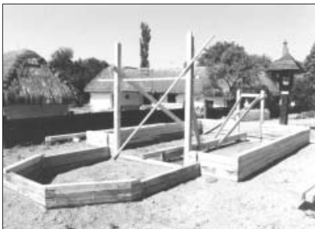
A templom alapozása a zalaegerszegi Göcseji Falumúzeumban

A magyar államiság millenniumára és az ezredév megünneplésére készülve a lokálpatrióta Együtt Zalaegerszegért Egyesület felvállalta a régóta szunnyadó gondolat újraélesztését, és gyűjtést indított ennek az