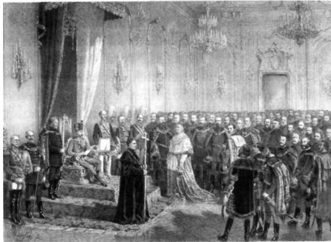
Eduard von Engerth: Koronázás (részlet) olajfestmény, 1872