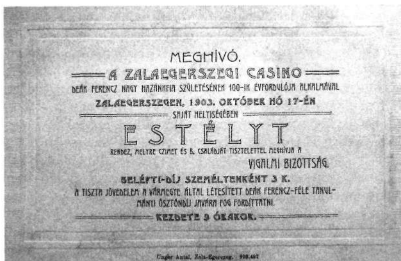
Meghívó a zalaegerszegi Kaszinó estélyére

Az ünnep elmúltával véget ért a várás, "Deák szellemének mindent kibékítő, áldó ereje" nem hatott többé, az ország visszasüppedt a pártcsatározások mindennapjaiba. Egy év múlva pedig megbukott a magát Deák szellemi örökösének tartó Szabadelvű párt.