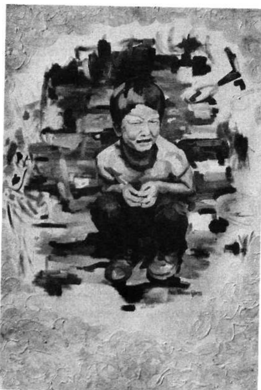
Tánczos György: Nyár, I. olaj, vászon