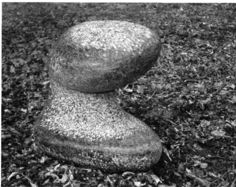
Lukács József: Kikötői Buci labradori gránit