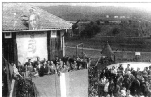
A MAORT állami kezelésbe vételének bejelentése (Lovászi, 1948)