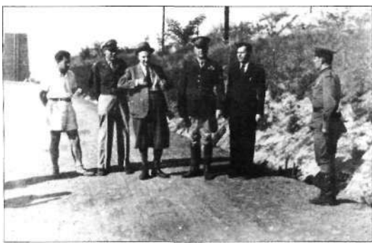
A SZEB látogatása (1945)

A második világháborút követő évtized a magyar gazdaságban gyökeres változásokat hozott. A tőkés gazdaság évszázados útja szakadt meg, egy öntörvényű fejlődést térítettek politikai tényezők zsákutcába. Ezen hatás alól a magyar gazdaság egyetlen szektora sem lehetett kivétel. Legközvetlenebbül és először az ipar területén tapasztalhatók ezek a folyamatok. Következett ez a háború gazdasági következményeinek felszámolásában, az újjáépítésben, a stabilizációban és nem utolsósorban a jótételei fizetésében betöltött szerepéből.