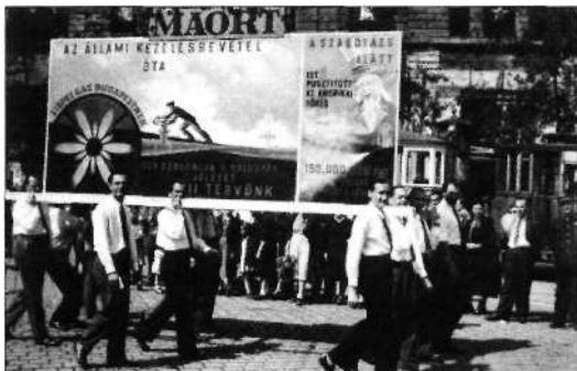
Felvonulás Budapesten (1949. május 1.)