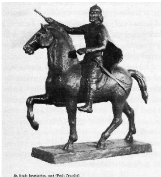
Sz. István lovasmárvány, 1938

A derűs, közvetlen, természetes hangvételű, finoman szarkasztikus humorral megfogalmazott írás két fontos ismerettel gazdagítja a levélíró Medgyessy Ferencről ismert képet. Mindenek előtt az őszinte rácsodálkozás képessége, ahogyan a mesterség megújításában felvállalt szobrászi gondolat és szívós következetességgel követett formanyelv térnyerését és igá-