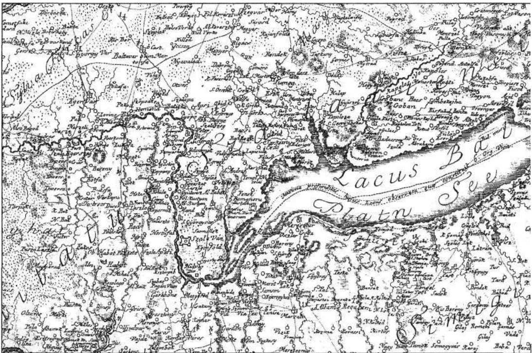
Müller Ignác térképének részletei