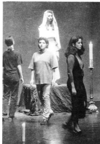
Középkori Mária-ének

O: Fönn a Zárdában. Ott is laktunk. Nem is tudom, mi volt tulaj-