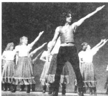
Rossa: Magyarok