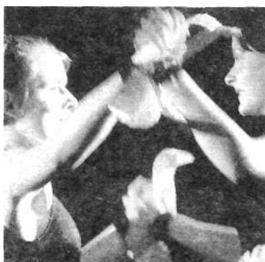
Madarak (Szemek)