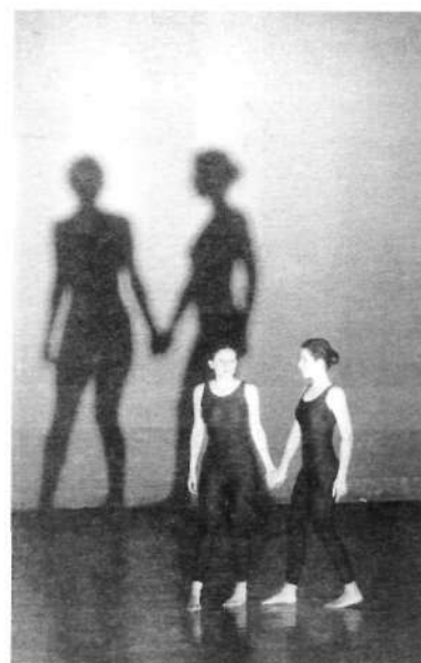
Lutoslawski: Adagio