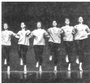
Tánc ír népzene

O: Igen, én mindig azt mondom, hogy egy főiskola addig nem főiskola, ameddig nincs valamilyen művészeti csoporttevékenység, de azt hiszem, nem nagyon hiszik el. Most, szerencsémre, eljöttek Pécsről. Az első előadás volt, amire eljöttek. Én minden évben igyekeztem hívni a Pécsi Orvostudományi Egyetemről valakit, hogy lássa, a saját intézményükben milyen munka folyik a tanításon kívül. Most eljött a gazdasági igazgató, és őszinte csodálatát fejezte ki. Bízom, hogy elvitte jó hírünket Pécsre. A közönségünk az megvan. Mindig teltház előadást csinálunk. De ennyire telt ház soha nem volt, mint most, hogy a pótstúdiókat is el kellett adni, és még az sem volt elég, még a lépcsőn is ültek. Ami különösen jó érzés volt, hogy nagyon sok pedagógus és sok orvos volt ott. Ez az együttes nem szülőkkel tudja megtölteni a nézőteret vagy rokonokkal. Hiszen lányaim családjai Nyíregyházától Szegedig, Budapesttől Miskolcig vannak, és hát ha el is jöttek, akkor is egy-két ember ha eljött. Megvan a magunk intellektuális közönsége. Azt hiszem, hogy ez a fajta műsor, amit mi csinálunk, ne vedd nagyképszerűségnek, amit én csinálok a színpadon, amit mondani akarok a közönségnek, az azt hiszem intellektuális közönségnek való. Valamilyen alap, valamilyen felkészültség, nem táncos, egyáltalán műveltségbeli nyitottság, úgy gondolom, mindenképpen kell, mert