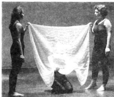
Misztikus álmok