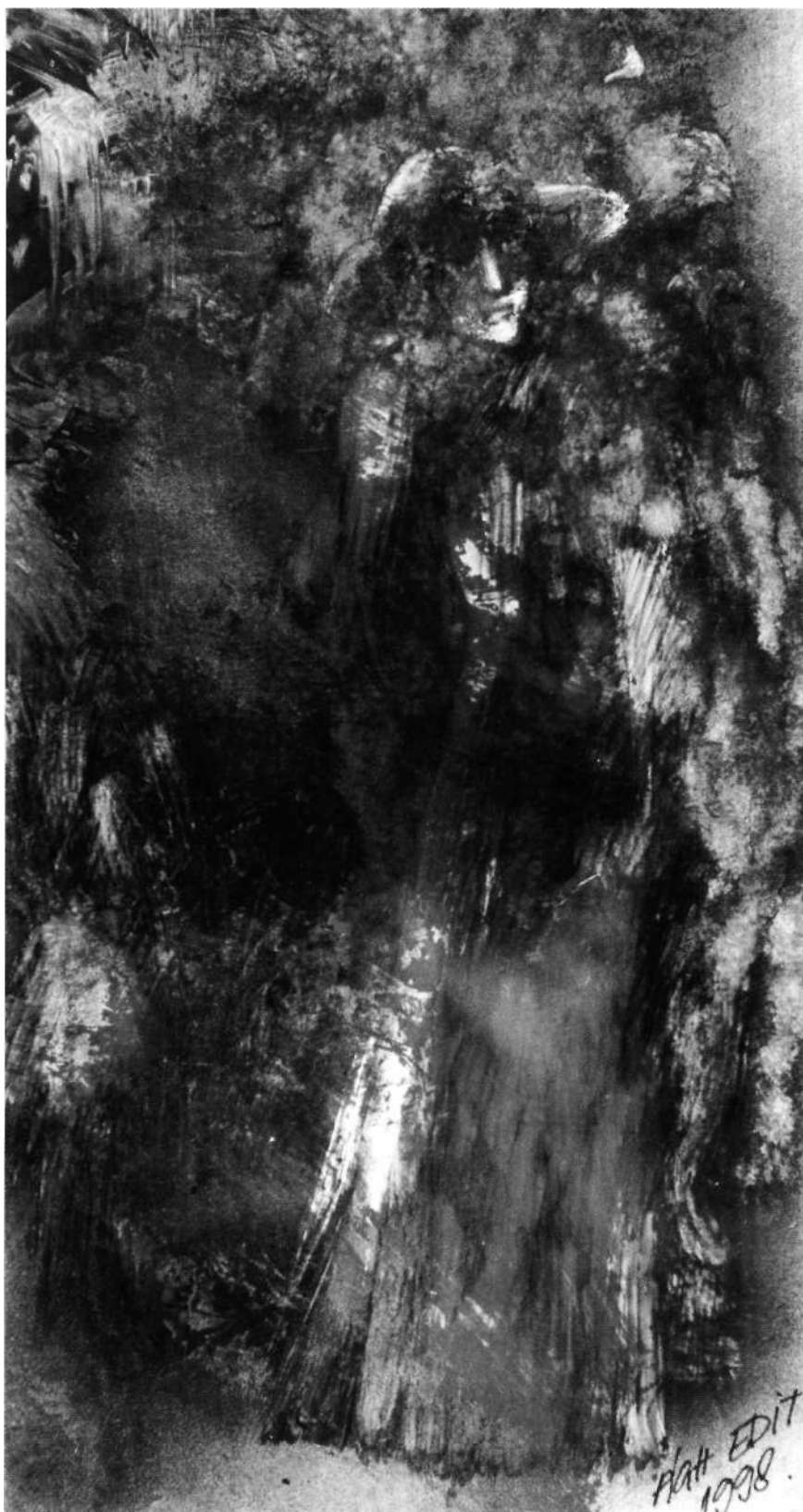
Régi szép idők