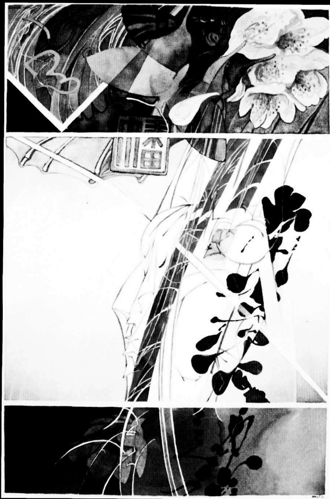
• Keleties kép •