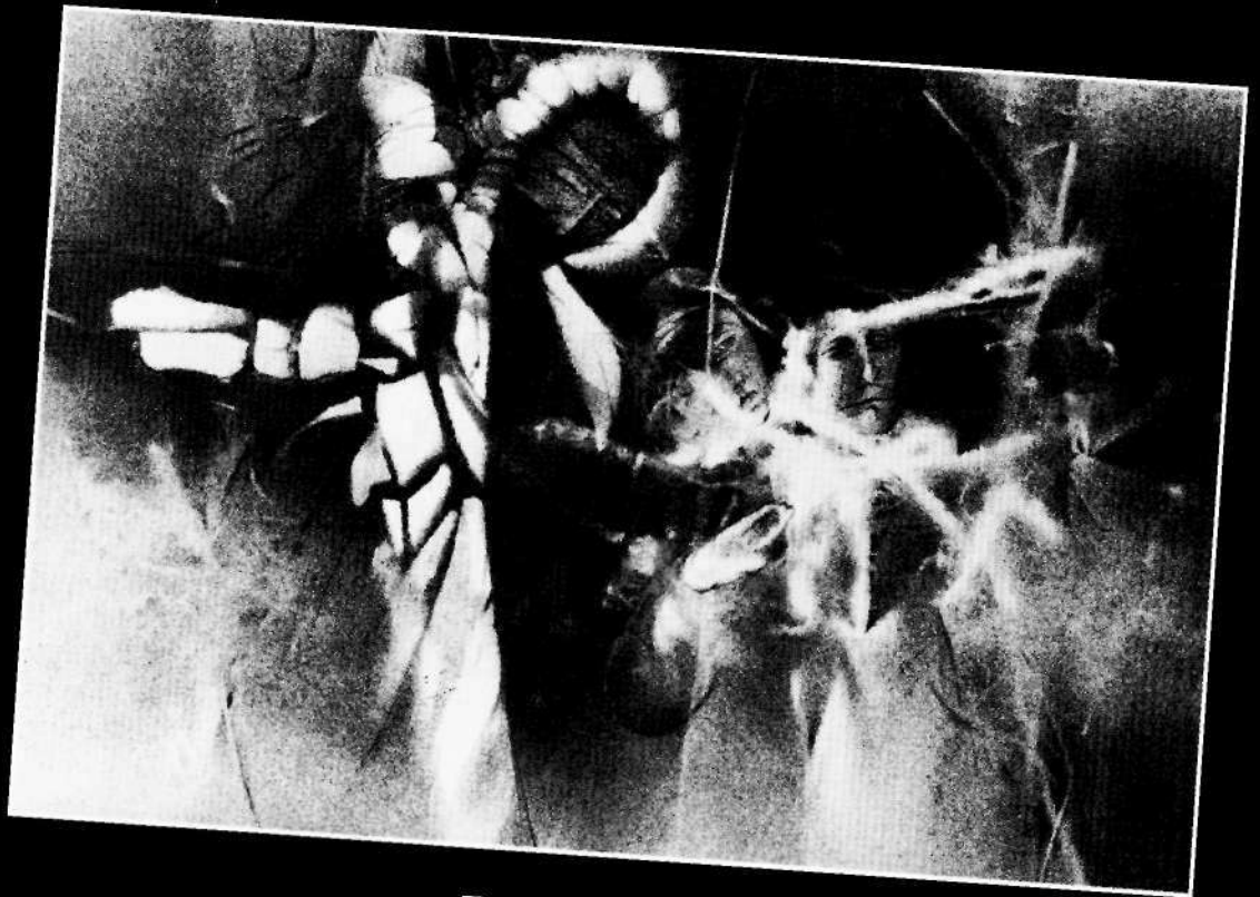
• Teátristák •