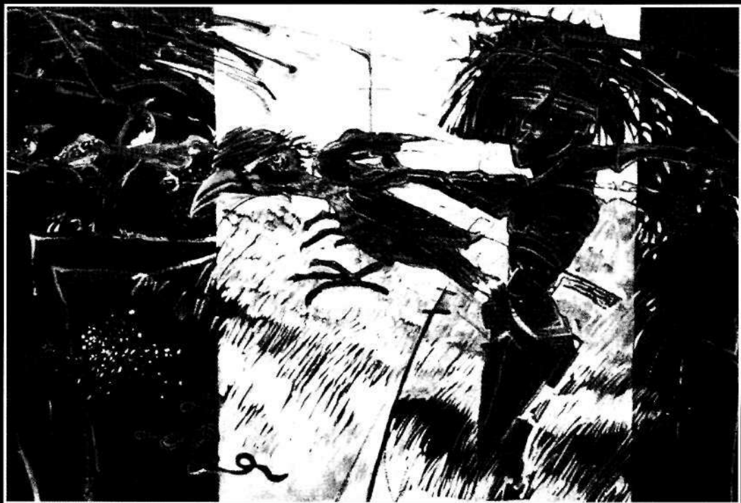
• Korpusz madarakkal •