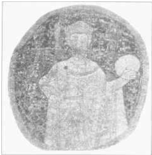
Szent István egyetlen hiteles ábrázolása a paláston

király hatalmának érvényre juttatásáról ugyanakkor mindenekelőtt világi intézmények voltak hivatottak gondoskodni. A legfőbb politikai döntések a királyi tanácsban születtek, amelyben a fontosabb világi méltóságviselők mellett az ország püspökei is helyet kaptak. A tanács tagjainak szerepe abban állt, hogy véleményük kifejtésével segítsék a királyt a kormányzásban. A döntés joga a királyt illette meg, ám az előkelők álláspontjának figyelembevétele mégis célszerű volt, hiszen a kor felfogása szerint a tanács képviselte a - politikai értelemben vett - országot. Törvényei rendelkezéseiben maga István is számos alkalommal hivatkozott a királyi tanács határozataira.