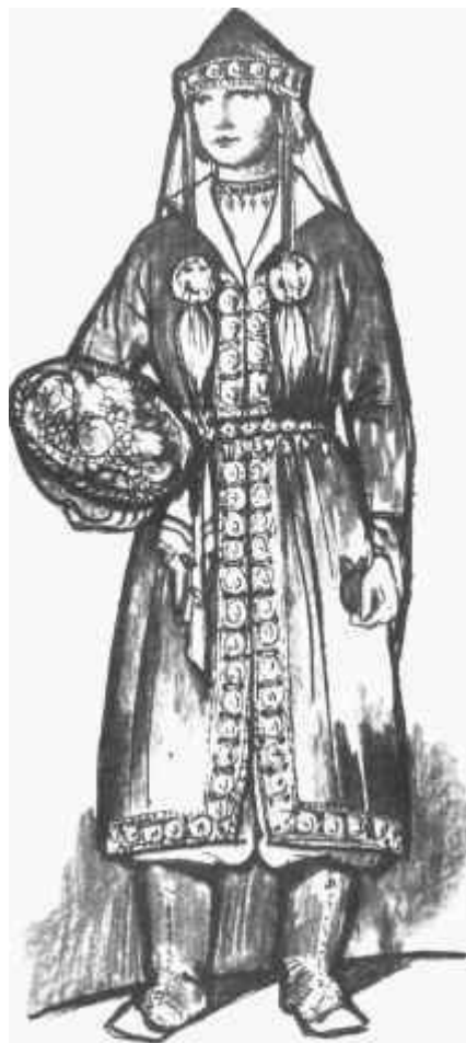
Honfoglalás kori női viselet