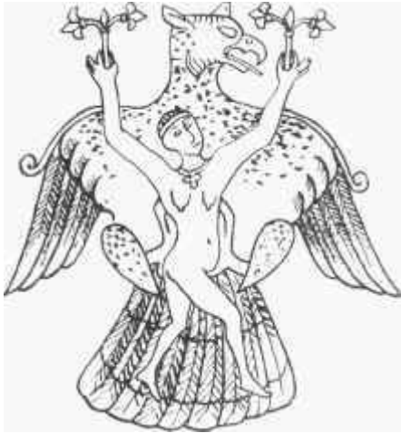
A nagyszentmiklósi kincs rajza

zadban bekövetkező újabb népmozgások megrajzolták a mai Európa etnikai arculatának főbb vonásait.