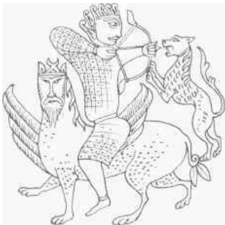
A nagyszentmiklósi kincs rajza