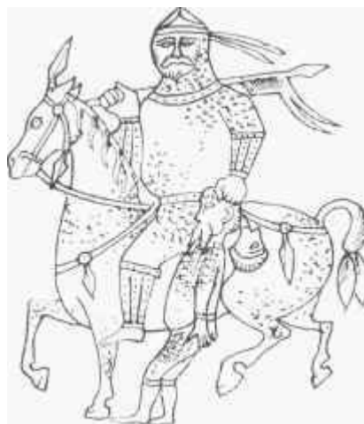
A nagyszentmiklósi kincs rajza

1100 év távlatából visszatekintve a honfoglalás jelentősége a mai magyarság számára magától értetődő: ennek az eseménynek a során vették ősei birtokba azt a területet, melyet mai is hazájának vall. Az egyetemes európai történelem szempontjából nem kevésbé fontos eseményről van szó, hiszen a magyarok Kárpát-medencei honfoglalása szervesen illeszkedik abba a világtörténelmi folyamatba, amelynek eredményeként az V-VIII. században lezajlott germán népvándorlást követően a VII-IX. szá-