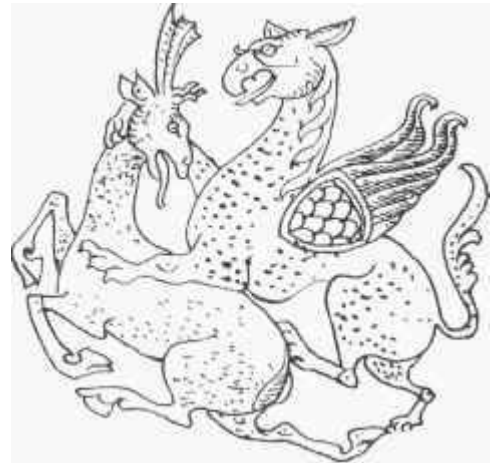
A nagyszentmiklósi kincs rojza

Mivel a középkor államában az egyházra a lelkipásztori tevékenység mellett kifejezetten politikai feladatok is hárultak, az egyházszervezés elválaszthatatlanul hozzátartozik az államalapítás történetéhez. A