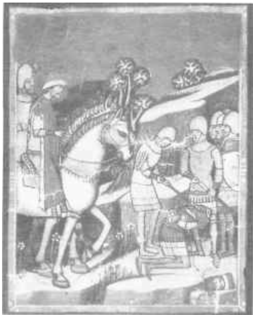
A lázadó Koppány kivégzése (Képes Krónika)

A vármegyék eredetéről és esetleges mintáiról számos vita zajlott és zajlik jelenleg is a történetírásban. Ha jó néhány kérdésben még ma sem látunk tisztán, az mindenesetre világos, hogy az első vármegyék az államalapítás idején, a hazai viszonyokból kisarjadva keltek életre. A vármegyék területileg összefüggésben álltak a várispánságokkal, amennyiben tudniillik a megyék egy-egy vár uralmi körzetére terjedtek ki. A várispánság és a vármegye mégis egymástól különböző intézmények voltak. Az utóbbi ugyanis a helyi várispánság földjein túlmenően a határain - "megyéjén", hiszen a szlávból átvett szó eredetileg 'határ' jelentésű volt - belül fekvő királyi, egyházi és magánbirtokokat is magában foglalta, s ily módon kezdetől fogva összefüggő területtel rendelkezett. Egy újabb kapcsolódási pontot jelentett ugyanakkor a két intézmény között, hogy a várispánság élén álló személy azonos volt a megyét igazgató megyésispánnal, aki kettős minőségében kiterjedt katonai, bírói, gazdasági és igazgatási jogokkal rendelkezve képviselte a királyt megyéjében. A megyésispánok - ellentétben a királyi szolgálónépek különböző csoportjainak ispánjaival - a királyi tanács tagjai voltak. Mindezen, az államalapítás évtizedei során kialakított intézményeknek, ha az idők folyamán több-kevesebb változáson át is estek, évszázadokon keresztül meghatározó szerep jutott a magyar államszervezetben.