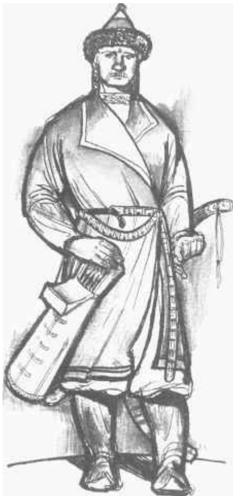
Honfoglalás kori férfiviselet

A magyar honfoglalás ismereteink szerinti első részletes összefoglalása jó háromszáz évvel az események után készült el. A munka szerzőjét Névtelenként (Anonymus) szokás emlegetni, részint mert ő maga a névtelenség homályába burkolózott "mesternek mondott P"-nek nevezve magát, részint pedig azért, mert a kilétének felderítésére több mint két évszázada meg-megújuló erőfeszítésekkel folytatott kutatások mindmáig nem vezettek megnyugtató eredményre. Személyéről ily módon csak annyi tudható bizonyosan, amennyit munkájában elárul. Megemlíti például, hogy egykoron Béla király jegyzője volt, azt viszont elhallgatja, hogy melyiké. Az idők során mind a négy szóba jöhető magyar uralkodó mellett merültek fel érvek, s bár jelenleg is vannak hívei a kutatók között más megoldásoknak, a történészek többsége ma már kétségtelennek tartja, hogy a kérdéses király III. Bélával /1172-1196/ azonosítható, s ennek megfelelően az írás valamikor a XIII. század elején készült, hogy pontosabban mikor, az további viták tárgya. Anonymus munkájának lapjain a honfoglaló magyar hősök diadalmas csatákban győzik le a Kárpát-medence ellenséges fejedelmeit, akik többnyire életüket vesztik a harcokban, népük pedig alázatosan hódol.