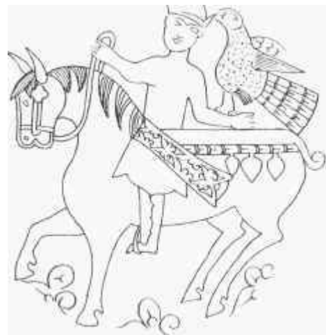
A nagyszentmiklósi kincs rojza